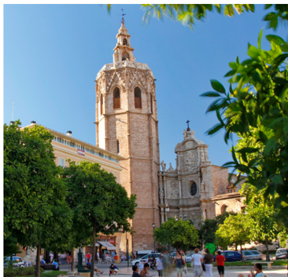
▲ 瓦伦西亚大教堂 瓦伦西亚

而且从瓦伦西亚到达其他的风景绝美的小城镇，比如布尼奥尔，雷克纳，哈蒂瓦或萨贡托，也非常便利。