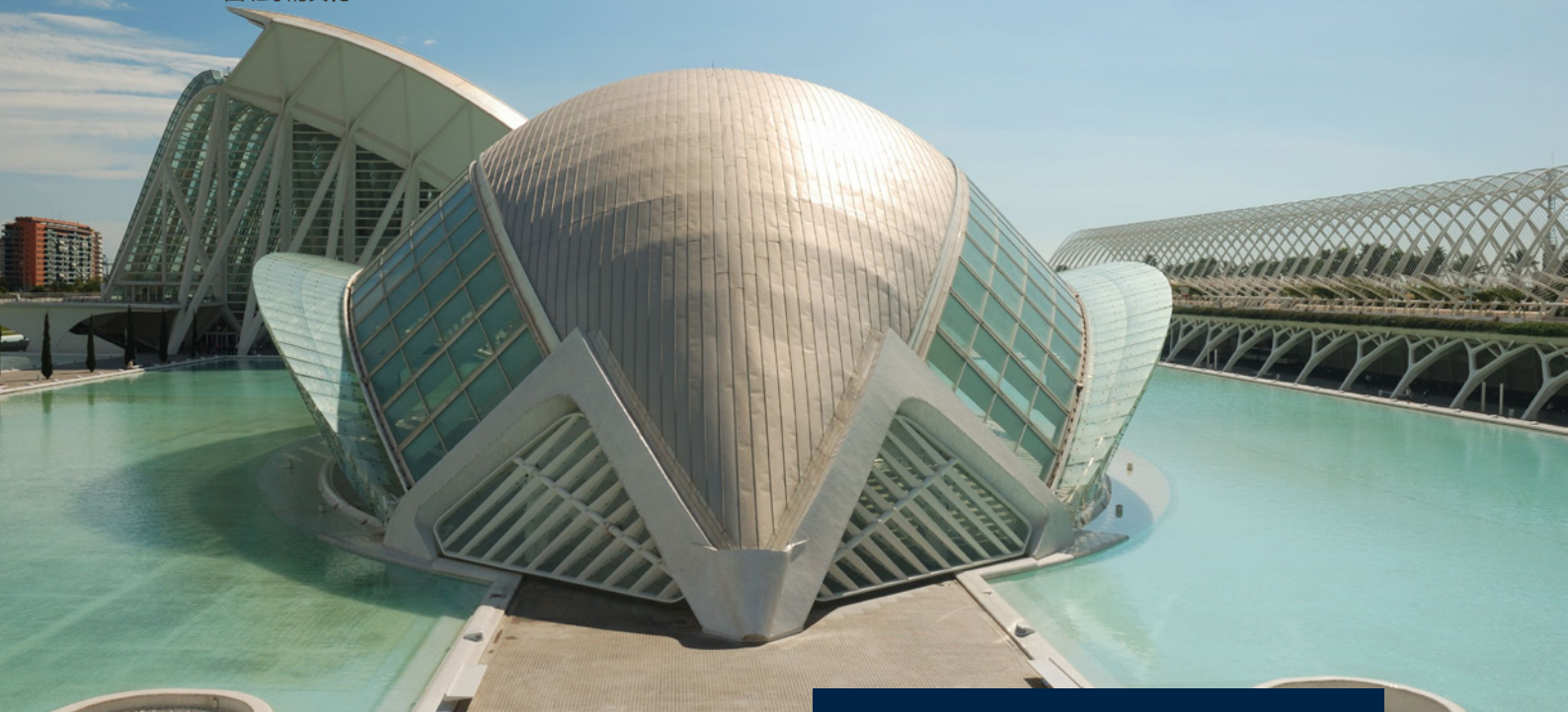
▲ 艺术科学城 瓦伦西亚