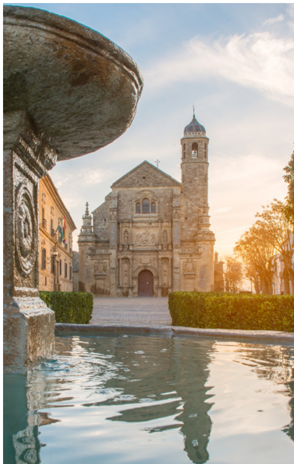
▲ 萨尔瓦多礼拜堂 乌韦达，哈恩

伊维萨岛的老城区被称为“达尔特维拉”，被联合国教科文组织列为人类文化遗产。游览围绕老城区的文艺复兴式城墙，其初建于16世纪，旨在抵御土耳其人的入侵。