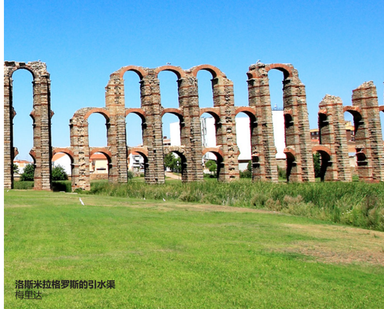
洛斯米拉格罗斯的引水渠 梅里达

这座位于加纳利群岛特内里费岛中的城市，如画的风光、别致的街道会带着你回到旧日时光。其完美的殖民时期建筑规划包括了一座威风庄严的大教堂和17和18世纪的许多贵族府邸。