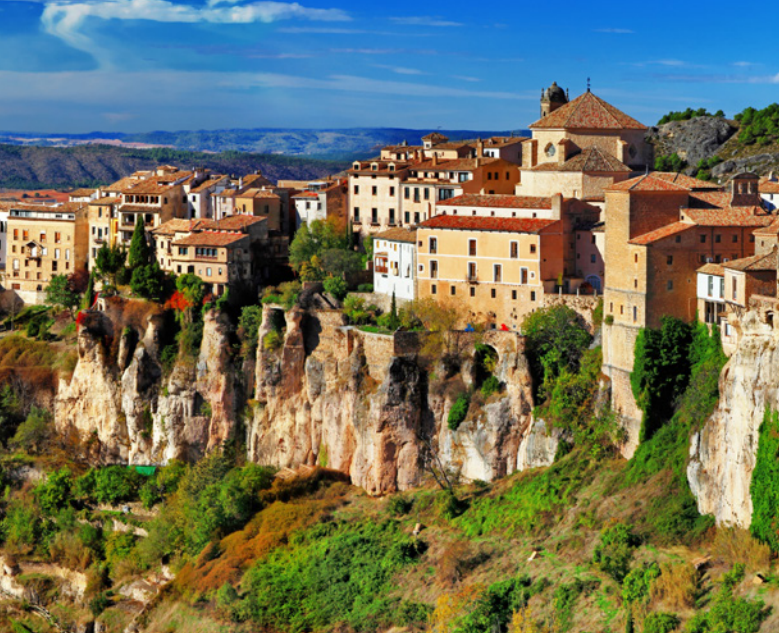
▲ 吊脚楼 昆卡