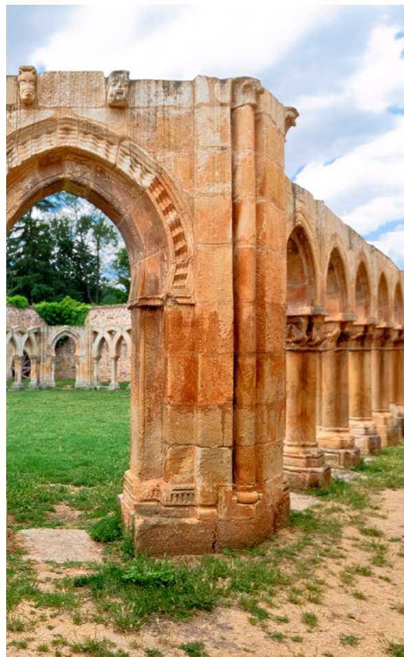
▲ 圣胡安德杜埃罗修道院 索里亚

了解这个基督教中世纪建筑的典范。其拱廊也是当时许多建筑趋势的一个缩影：包含了罗马风格，哥特风格和穆斯林风格。