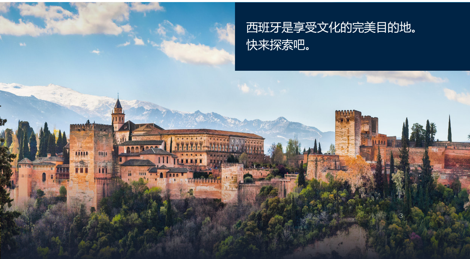
▼ 阿尔罕布拉宫 格拉纳达