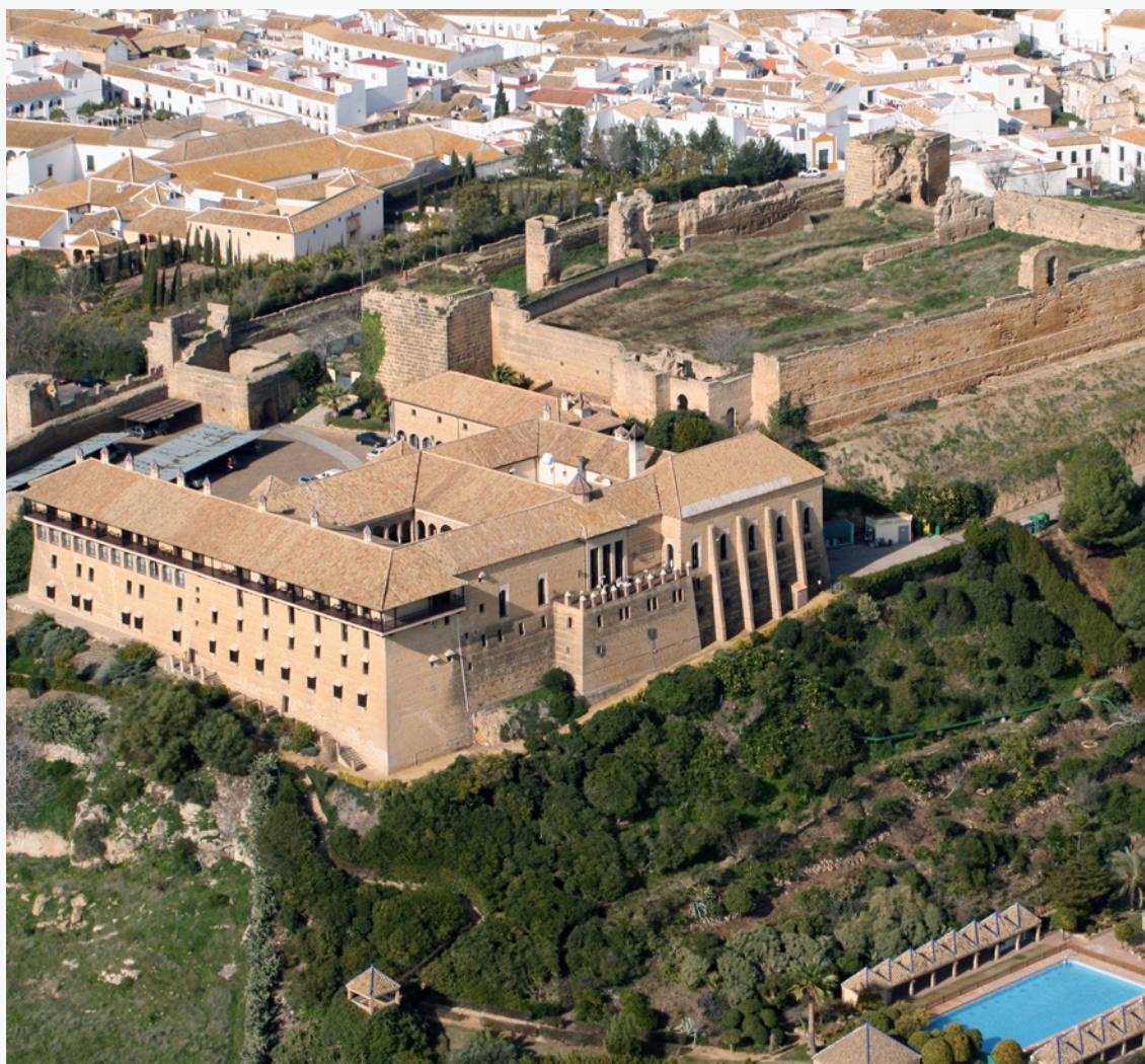
▲ 卡尔莫纳古堡酒店 塞维利亚

目前西班牙共有90多家古堡酒店。如果你喜欢亲近历史，那么古堡酒店是你的不二选择。访问 www.parador.es 网站寻找你喜欢的古堡酒店吧。