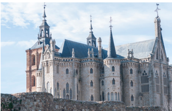
▲ 主教宫 阿斯托加

站在该宫殿前你会以为它是童话故事中的城堡，带有雉堞、瞭望塔以及环绕的护城河。该建筑是新哥特风格的现代主义建筑，也是罗丝卡米洛斯博物馆目前的所在地，是由高迪设计修建的。