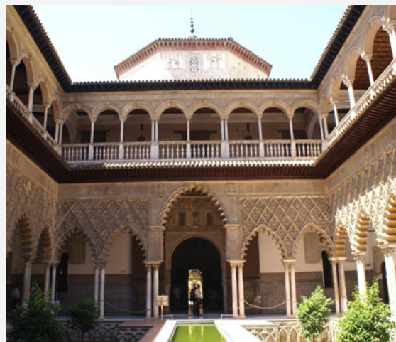
▲ PÁTIO DAS DONCELLAS DO REAL ALCAZAR DE SEVILHA SEVILHA

ma de estrela de 6 pontas e no final de cada uma delas há uma torre cilíndrica. Se vais no meados de junho, poderás assistir às jornadas de recreação histórica no castelo, que recriam a vida militar medieval em todas as suas facetas.