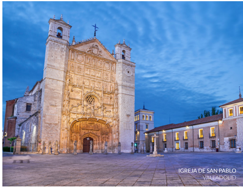
IGREJA DE SAN PABLO VALLADOLID