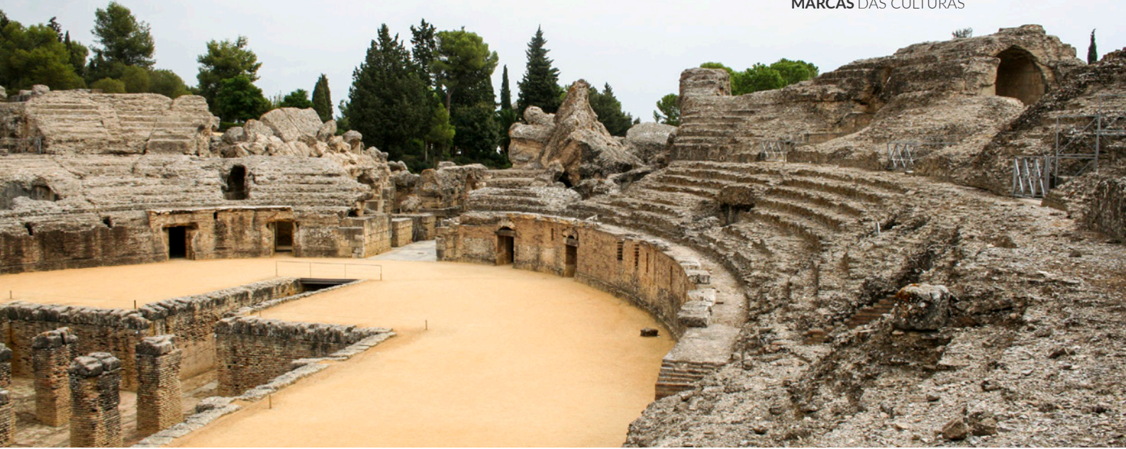
▲ ANFITEATRO ROMANO DE ITÁLICA SANTIPONCE (SEVILHA)

Através da Rota dos Almorávidas e Almóadas descobrirás a herança arquitetónica desta civilização, fundamentalmente castelos e elementos defensivos. São 400 quilómetros que partem da cidade de Algeciras (Cádiz) e que, ao longo de dois troços, chegam até Granada . Jerez de la Frontera (Cádiz) ou Ronda (Málaga) são algumas das localidades que visitarás durante o trajeto.