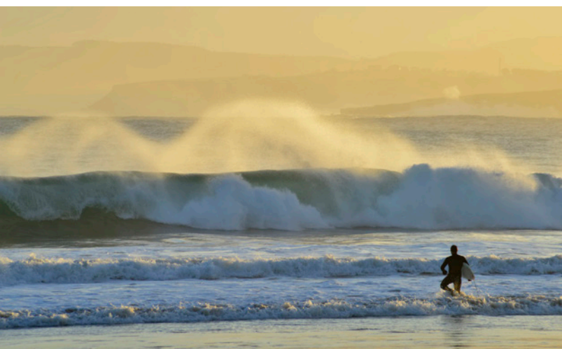
▲ LAREDO CANTÁBRIA

Segue as pisadas de Carlos V depois de abdicar. O monarca chegou ao norte de Espanha desde Bruxelas com mais de 50 barcos e começou uma viagem por Cantábria , Castela e Leão e Extremadura até chegar ao seu retiro, o Mosteiro de Yuste .