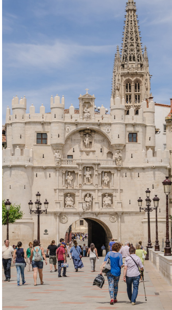
▲ ARCO DE SANTA MARÍA BURGOS

Adentra-te em Castela e Leão. Visita a medieval Medina de Pomar (Burgos), onde Carlos V passou uma noite, e o Alcázar de los Velasco , um impressionante castelo do século XIV. No monumental município de Burgos cruza o Arco de