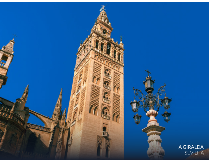
A GIRALDA SEVILHA

Esta rota também te permitirá adentrar-te por pitorescas localidades sevilhanas como Carmona , Marchena e Écija e de Granada, como Alhama de Granada .