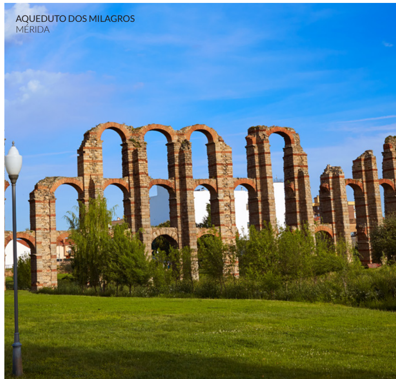
AQUEDUTO DOS MILAGROS MÉRIDA

A judiaria velha de Cáceres , dentro do recinto amuralhado, alberga a ermida de Santo António , onde antigamente estava a sinagoga. Vais ficar surpreendido com as casas caiadas em ruas íngremes, que aproveitam a muralha como parede traseira. A cidade é sede da Jornada Europeia da Cultura judaica, em setembro, e do Mercado Medieval das Três Culturas, em novembro.