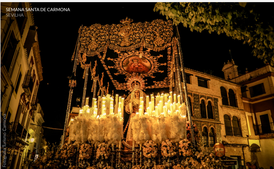
SEMANA SANTA DE CARMONA SEVILHA