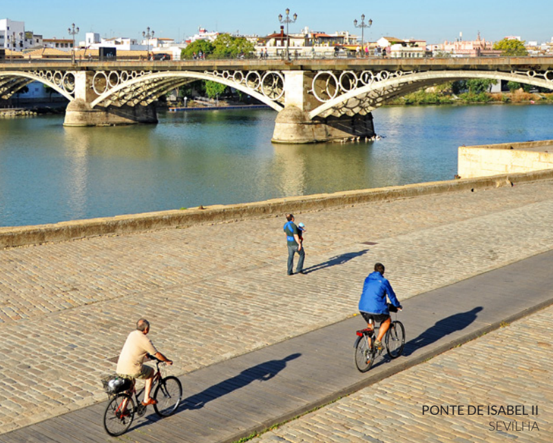
PONTE DE ISABEL II SEVILHA