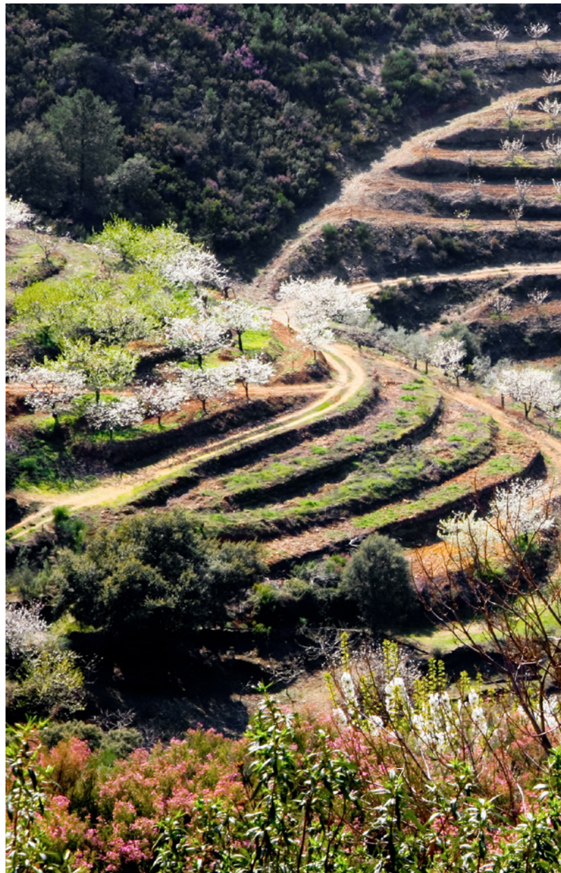
▼ VALE DO JERTE CÁCERES