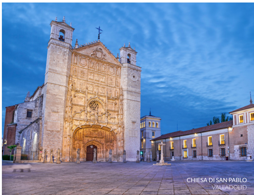
CHIESA DI SAN PABLO VALLADOLID