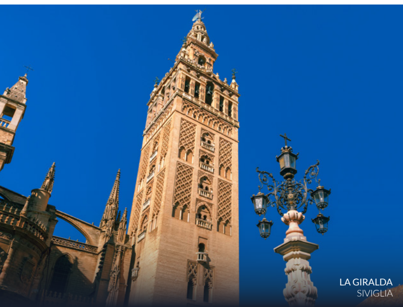
LA GIRALDA SIVIGLIA

Questo itinerario ti condurrà anche attraverso pittoresche località in provincia di Siviglia, come Carmona , Marchena ed Écija , ma anche di Granada, come Alhambra de Granada .