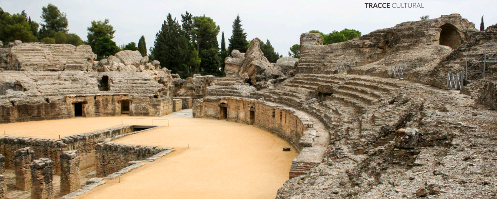
▲ ANFITEATRO ROMANO DI ITALICA SANTIPONCE (SIVIGLIA)

Lungo l' Itinerario degli Almoravidi e degli Almohadi scoprirai l'eredità architettonica di questa civiltà, composta essenzialmente da castelli ed elementi difensivi. Si estende per 400 chilometri partendo dalla città di Algeciras (Cadice) per poi dividersi in due ramificazioni che confluiscono nella città di Granada . Jerez de la Frontera (Cadice) e Ronda (Malaga) sono alcune delle località che visiterai durante il percorso.