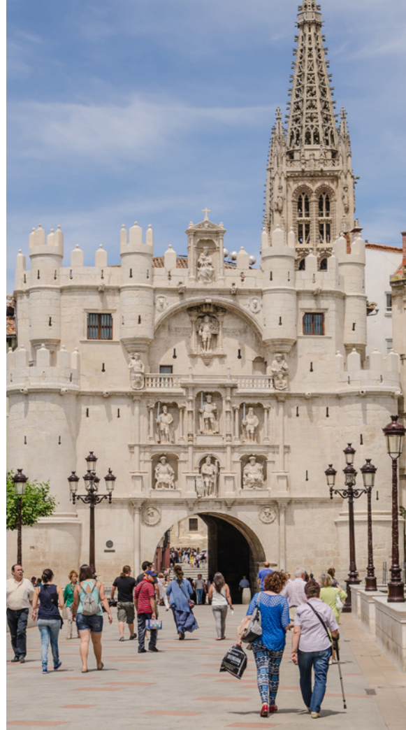
▲ ARCO DI SANTA MARÍA BURGOS

Avanza nel territorio della Castiglia e León. Visita la medievale cittadina di Medina de Pomar (Burgos), dove Carlo V trascorse una notte, e non tralasciare l' Alcázar de los Velasco , un impressionante castello del XIV secolo. Nella monumentale Burgos passa sotto l' Arco di Santa María , una delle antiche