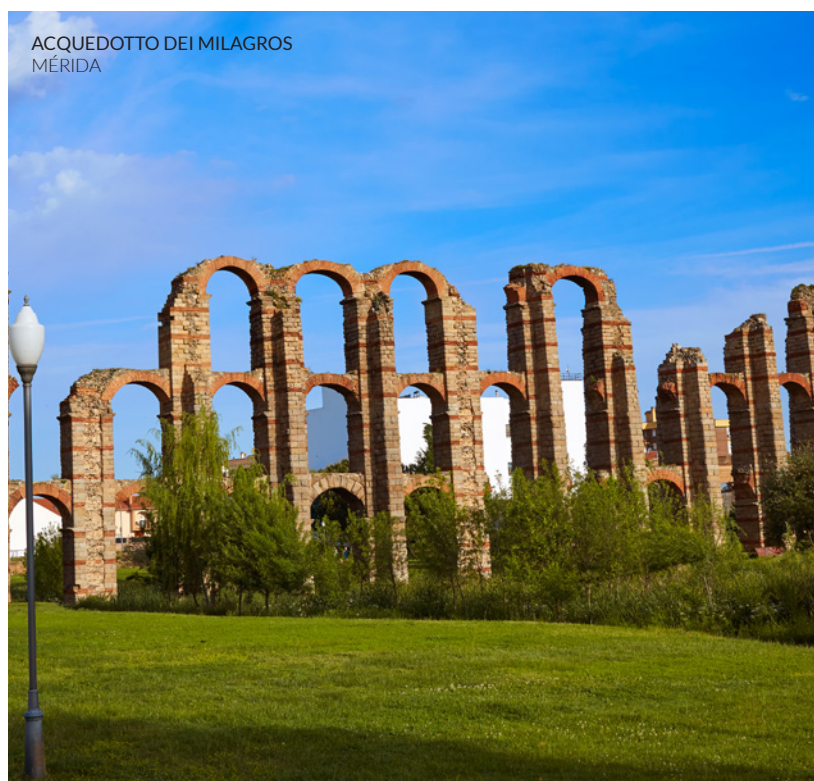
ACQUEDOTTO DEI MILAGROS MÉRIDA

All'interno delle sue mura di cinta, l'antico quartiere ebraico di Cáceres custodisce l' eremo di San Antonio , antica sede della sinagoga. Ti sorprenderanno le case imbiancate a calce lungo strade ripide, che sfruttano le mura di cinta come parete posteriore. A settembre la città accoglie le celebrazioni della Giornata Europea della Cultura Ebraica e