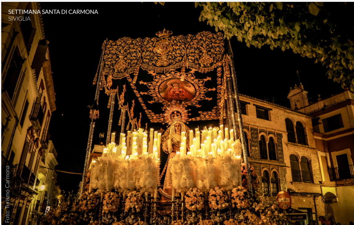
SETTIMANA SANTA DI CARMONA SIVIGLIA