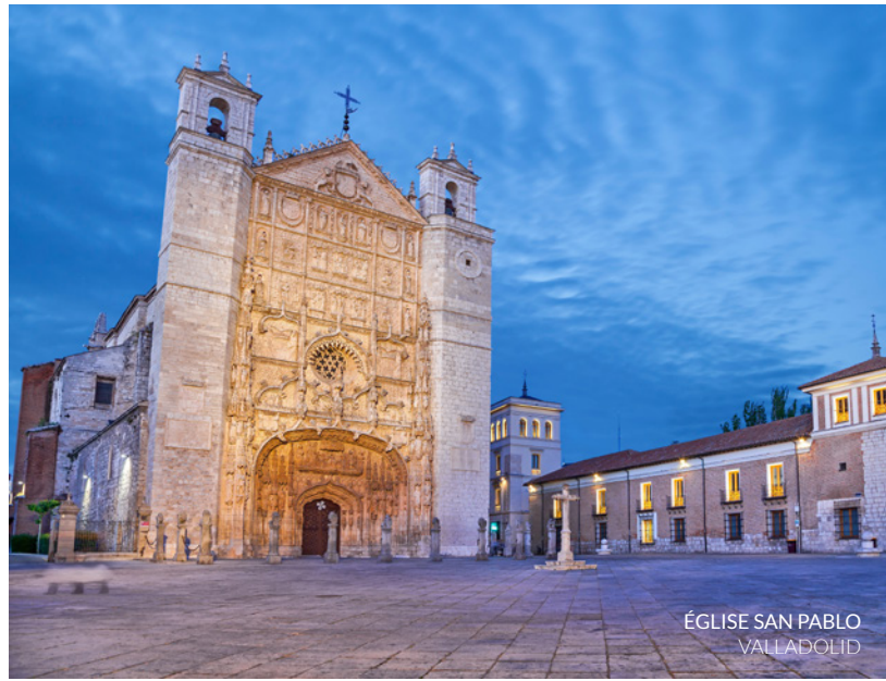
ÉGLISE SAN PABLO VALLADOLID