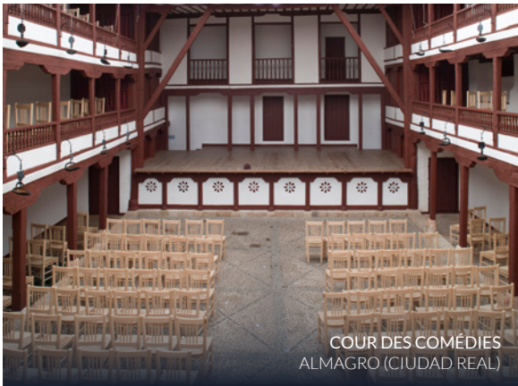
COUR DES COMÉDIES ALMAGRO (CIUDAD REAL)

La province de Ciudad Real abrite les célèbres moulins à vent de Campano de Criptana contre lesquels Don Quichotte s'est battu. Découvrez aussi Almagro , qui possède une cour des comédies du XVII e siècle. Et surtout, ne repartez pas sans avoir goûté le délicieux fromage manchego.