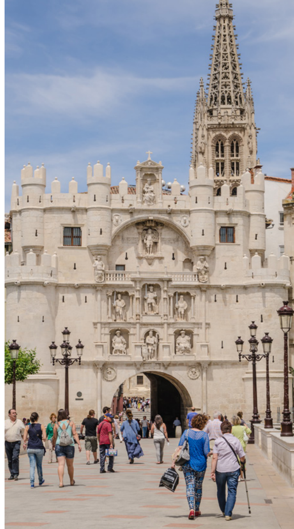
▲ ARC DE SANTA MARÍA BURGOS

Pénétrez ensuite dans la région de Castille-León. Visitez la ville médiévale de Medina de Pomar (Burgos), où Charles Quint a passé une nuit, ainsi que l' alcazar des Velasco , un impressionnant château du XIV e siècle. Parmi l'ensemble architectural de Burgos , passez sous l' arc de Santa María , l'une des anciennes portes