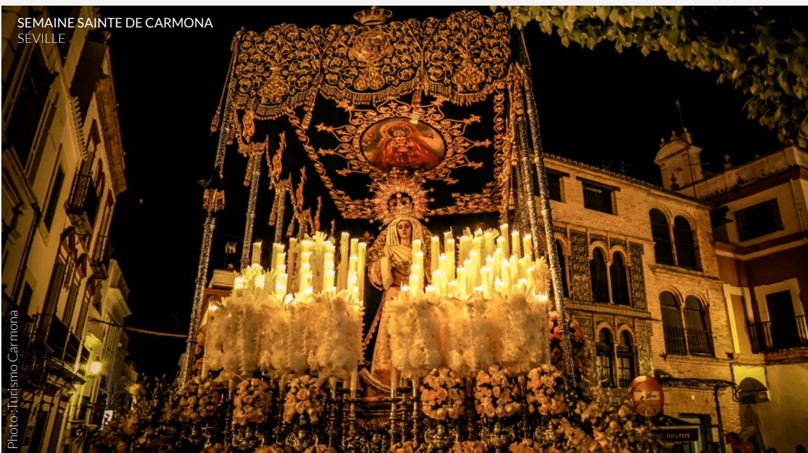
SEMAINE SAINTE DE CARMONA SÉVILLE