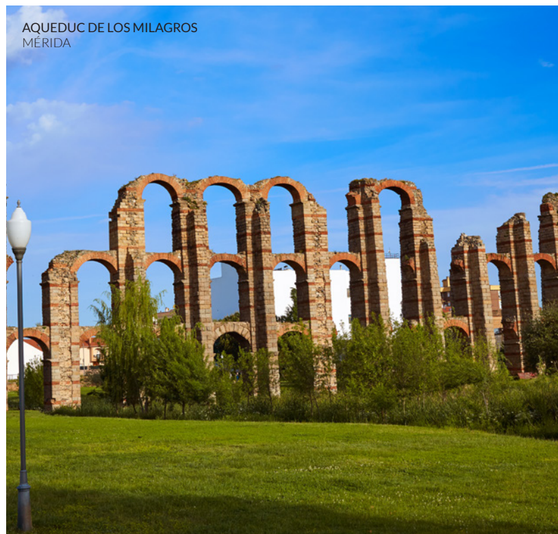
AQUEDUC DE LOS MILAGROS MÉRIDA

L'ancien quartier juif de Cáceres , situé au sein de l'enceinte fortifiée, possédait jadis une synagogue sur le site de l'actuel ermitage San Antonio . Ses rues escarpées bordées de maisons blanchies à la chaux et adossées aux remparts sont surprenantes. La ville accueille la Journée européenne de la culture juive, en septembre, ainsi que le marché médiéval des trois cultures, en novembre.