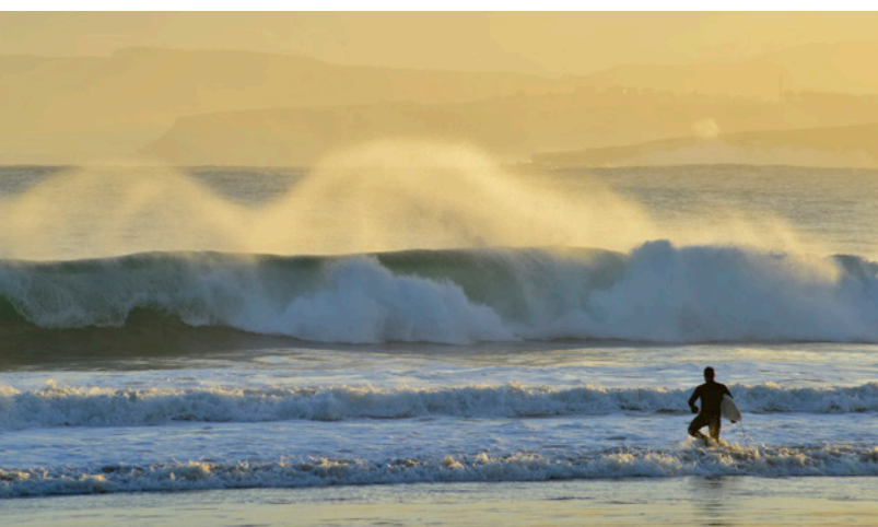
▲ LAREDO CANTABRIE

Suivez le chemin de Charles Quint après avoir abdiqué. Le monarque débarqua dans le nord de l'Espagne, depuis Bruxelles, avec plus de 50 navires. Il entreprit alors un voyage à travers la Cantabrie , la Castille-León et l' Estrémadure jusqu'à son refuge, le monastère de Yuste .