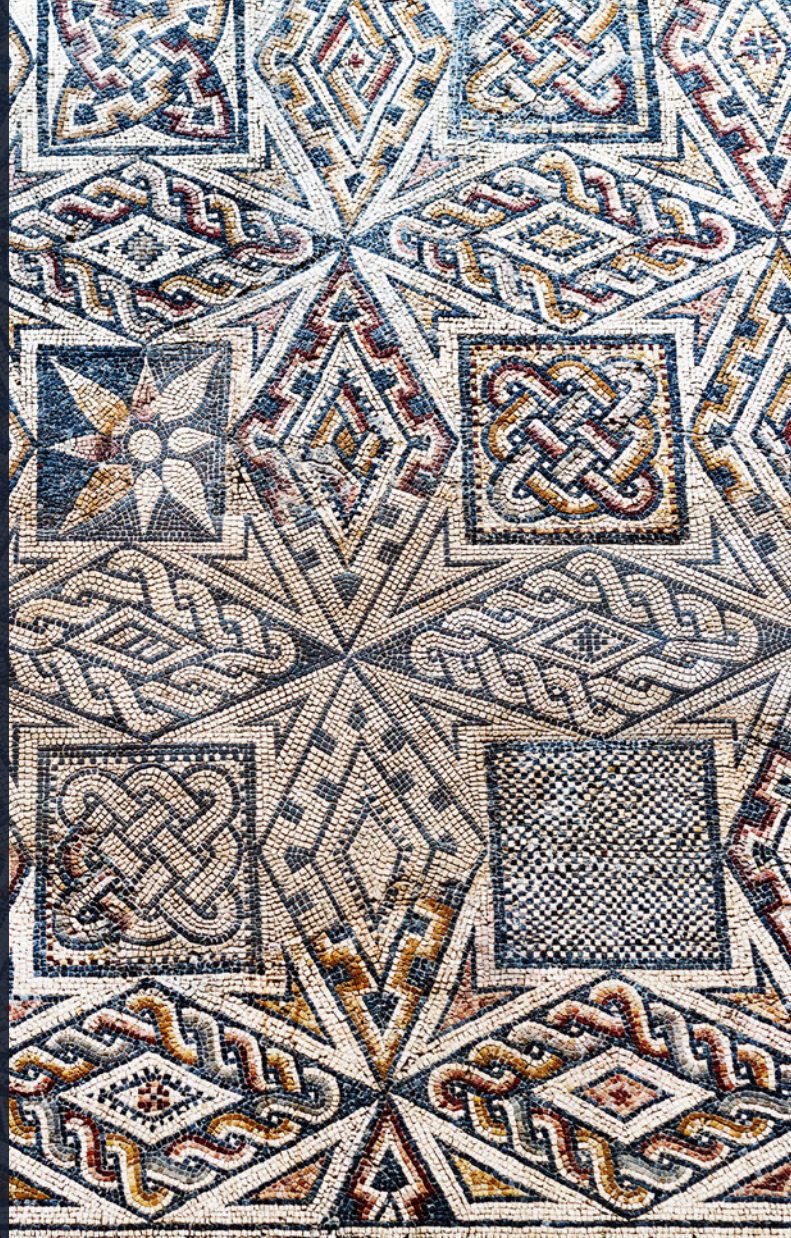
▲ MOSAÏQUE ROMAINE MUSÉE NATIONAL D'ART ROMAIN (MÉRIDA)

L' Estrémadure possède des plaines cultivées, des vignobles et des pâturages. Laissez-vous surprendre par la vieille ville de Cáceres et l'ensemble archéologique de Mérida , tous deux classés au patrimoine mondial de l'UNESCO. La province de Cáceres abrite la ville pittoresque de Hervás , célèbre pour son ancien quartier juif fait de ruelles raides et étroites, ainsi que Plasencia et ses remarquables monuments, notamment deux cathédrales, des palais et des demeures seigneuriales. Ne manquez pas de savourer le jambon ibérique local, l'un des meilleurs du pays, et détendez-vous dans la station thermale de Baños de Montemayor .