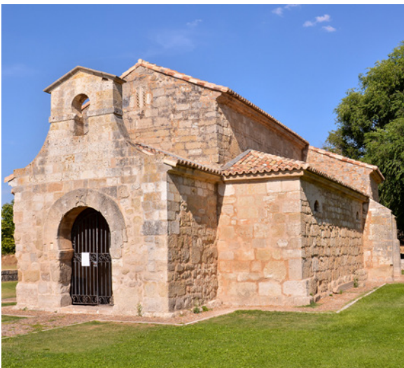
▲ ÉGLISE SAN JUAN DE BAÑOS VENTA DE BAÑOS (BURGOS)

La dernière étape de la route, en Estrémadure , est dédiée à la nature. Si vous avez la chance de suivre la route au printemps, vous verrez les cerisiers en fleurs qui couvrent la vallée du Jerte . Laissez-vous aussi surprendre par la réserve naturelle de la Garganta de los Infernos . Observez le vol de l'aigle royal et du vautour fauve et découvrez ses glaciers étonnants. Achevez cette route royale au monastère de Yuste, à côté duquel Charles Quint ordonna la construction d'un palais qu'il habita jusqu'à la fin de ses jours.