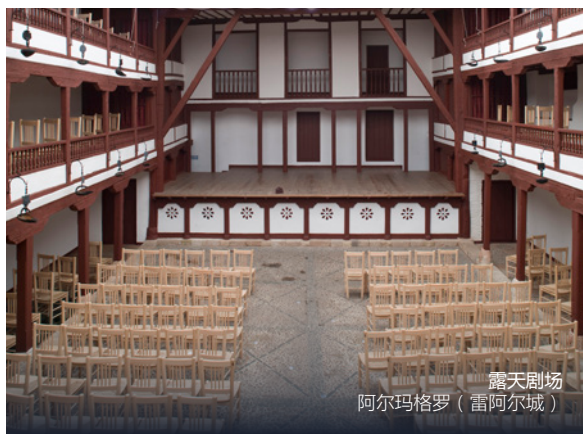
露天剧场 阿尔玛格罗（雷阿尔城）

在雷阿尔城等待着你的是一坎波德克里普塔纳（Campo de Criptana）的大风车，唐吉诃德就是在那里与风车大战。探访阿尔马格罗（Almagro），这里保留着一处十七世纪的露天剧场。走之前一定别忘了尝一尝拉曼查奶酪。