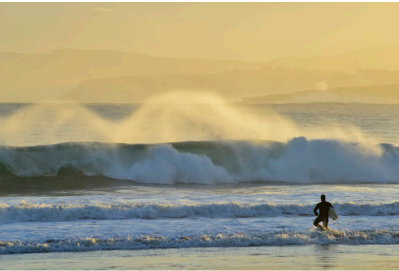
▲ 拉雷多 (LAREDO) 坎塔布利亚

追寻查理五世退位之后的足迹。这位国王从布鲁塞尔带着20只船的舰队抵达了西班牙北部，开始在坎塔布利亚、卡斯蒂亚和莱昂以及埃斯特雷马杜拉展开了旅程，直到到达他的隐居之所尤思特（Yuste）修道院。