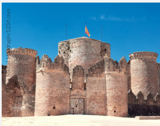
▲ 贝尔蒙特 (BELMONTE) 城堡 昆卡

巴亚多利德的莫塔 (Mota) 城堡， 韦斯卡的洛阿雷 (Loarre) 城堡， 科尔多瓦的阿尔莫多瓦德尔里奥 (Almodóvar del Río) 城堡.....在 西班牙全境你都能参观到壮观的城 堡。每个自治区都有自己的线路，你 可以到各个旅游信息中心咨询详情。