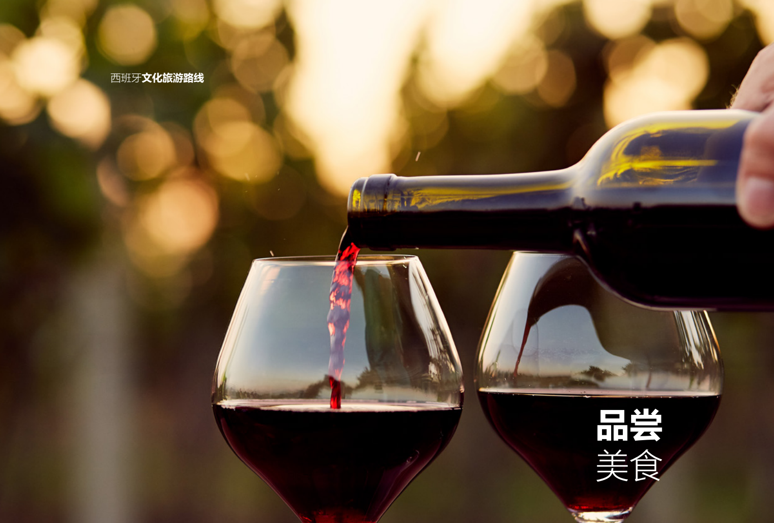
▲ 葡萄酒品鉴 拉里奥哈