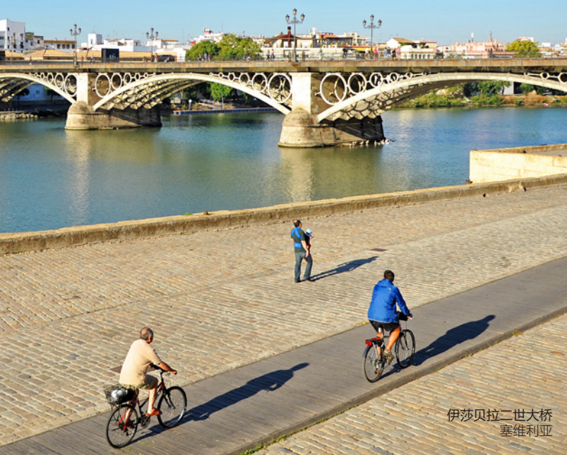
伊莎贝拉二世大桥 塞维利亚