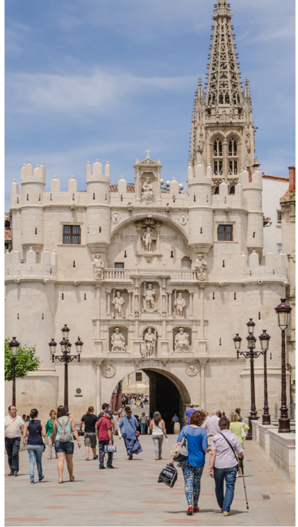
▲ 圣玛利亚拱门 布尔戈斯

探索卡斯蒂利亚和莱昂。到布尔戈斯的梅迪纳德波马尔 (Medina de Pomar) 一游，查理五世在这里过过一夜；也可以造访维拉斯科 (Velasco) 城堡，这座建于十四世纪的城堡十分宏伟。在极具纪念意义的布尔戈斯，穿过圣母玛利亚拱门，这是这座城市历史最悠久的城门之一。