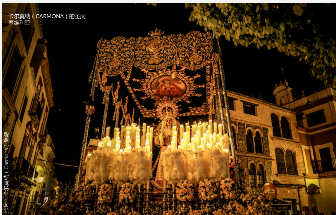
卡尔莫纳 (CARMONA) 的圣周 塞维利亚