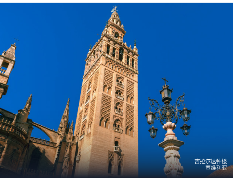
吉拉达钟楼 塞维利亚

沿着这条线路你还可以深入探访塞维利亚地区景色优美的村落，比如卡尔莫纳（Carmona）、马尔切纳（Marchena），以及埃西哈（Écija）；或是格拉纳达地区的村落，比如阿拉玛（Alhama）。