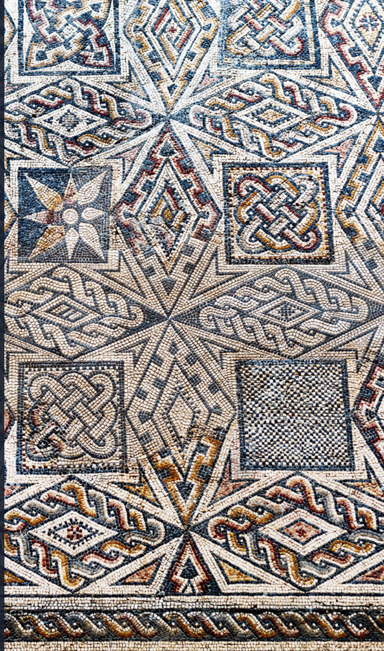
▲ 罗马式马赛克 罗马艺术国家博物馆（梅里达）

在埃斯特雷马杜拉，你会看到种满农作物的平原、葡萄园和牧场。卡塞雷斯的老城区和梅里达的考古遗迹会让你赞叹不已，这两个地方都被联合国教科文组织列为世界遗产。在卡塞雷斯省，等待你的还有风景秀丽的埃尔瓦斯（Hervás）山谷，以其满是狭窄陡峭街道的犹太区闻名；另外还有布拉森西亚（Plasencia）的历史建筑群，其中包括两座大教堂、宫殿和贵族宅邸。品尝一下西班牙最好的火腿之一埃斯特雷马杜拉出产的伊比利亚火腿；到古罗马浴池蒙特马约尔（Montemayor）浴池放松身心。