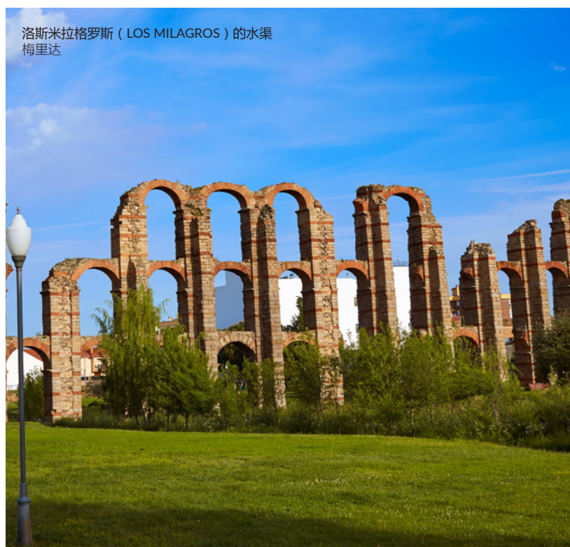
洛斯米拉格罗斯（LOS MILAGROS）的水渠 梅里达

卡塞雷斯的古犹太区坐落于城墙内，这里有圣安东尼奥（San Antonio）修道院，旧时为犹太教堂所在地。这里陡峭的街道边石灰石墙面的宅院会让你惊叹，这些宅院将城墙作为其后院墙。这座城市是在9月举办的欧洲犹太文化交流会的会场，11月这里还举办三种文化融合的中世纪市场。