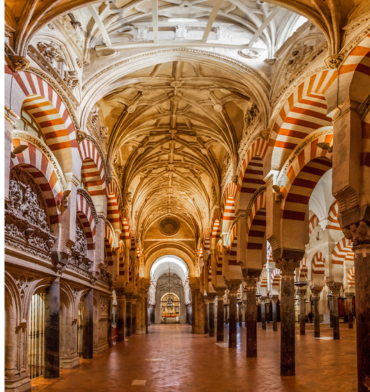
▲ 科尔多瓦大清真寺 科尔多瓦

在塞哥维亚，你可以在修复一新的，充满历史文化价值的犹太区漫步。在这个区域坐落着旧时的犹太大教堂，如今成为了耶稣圣体教堂；你还会看到旧时的犹太墓地。