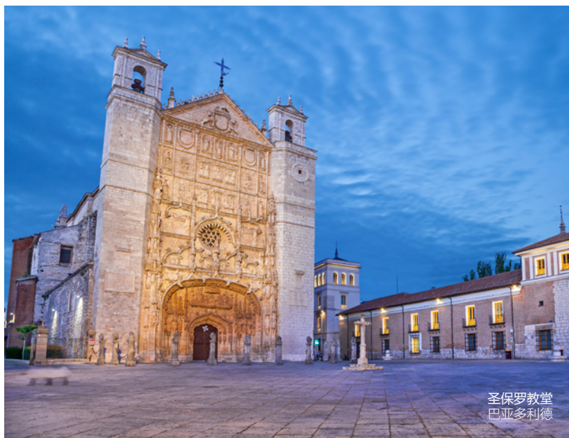
圣保罗教堂 巴亚多利德

在这条线路的最后一段埃斯特雷马杜拉，你可以尽情欣赏自然美景。如果你有幸在春天来访，就能在赫尔特（Jerte）山谷看到樱花绽放。地狱咽喉（Garganta de los Infiernos）自然保护区的美景一定能给你带去惊喜。观赏划过天际的西班牙帝鵟和褐秃鹫，赞叹其冰川的美景。在尤思特（Yuste）修道院结束这条国王之旅，在修道院旁边就是查理五世命人修建的宫殿，他在此度过了人生最后的日子。