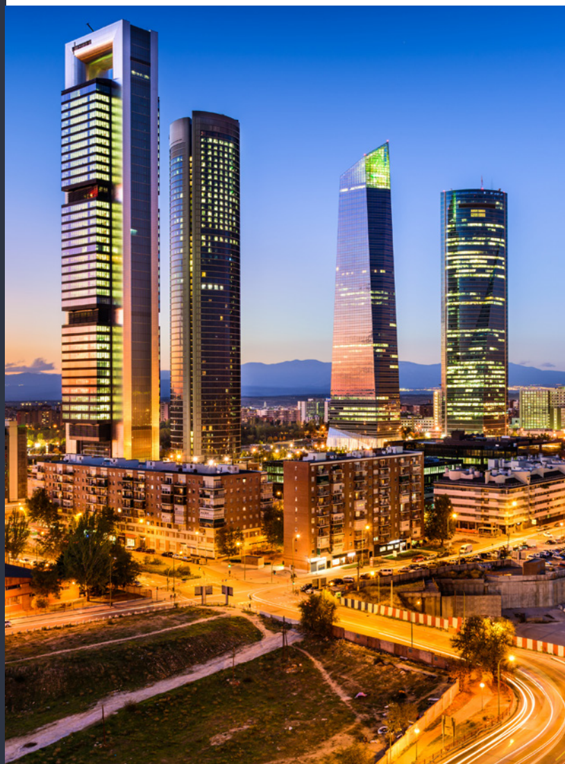
▲ КОМПЛЕКС «ЧЕТЫРЕ БАШНИ» МАДРИД

Почувствуйте головокружение на Стекло́нной башне (Торре де Кристаль) — самом высоком здании Испании 249-метровой высоты. Была построена под руководством Сесара Пельи (архитектора, которому также принадлежит проект знаменитых башен Петронас в Куала-Лумпуре) при сотрудничестве испанского архитектурного бюро Ortiz León Arquitectos . Его фасад в форме граненого стекла и вертикальный сад на вершине ставят его в ряд среди самых впечатляющих строений столицы.