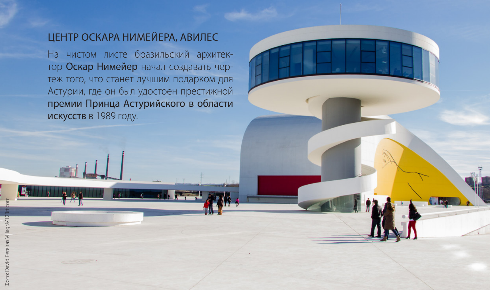
▲ ЦЕНТР ИМЕНИ ОСКАРА НИМЕЙЕРА АВИЛЕС

Эти первые штрихи превратились в его единственную работу в Испании, которой Нимейер, лауреат Притцкеровской премии, отводит место «самой важной и любимой за пределами Бразилии». Строение представляет собой огромный культурный центр, который состоит из концертного зала, купола, башни, многофункционального здания и открытой площади.