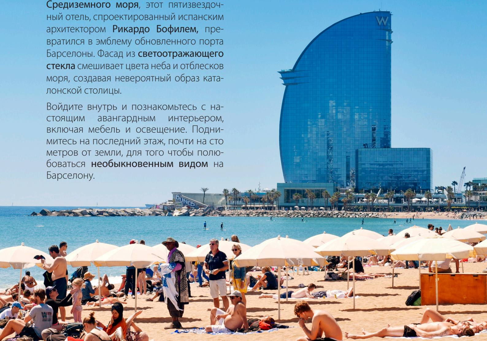
▲ W HOTEL БАРСЕЛОНА

Войдите внутрь и познакомьтесь с настоящим авангардным интерьером, включая мебель и освещение. Поднимитесь на последний этаж, почти на сто метров от земли, для того чтобы полюбоваться необыкновенным видом на Барселону.