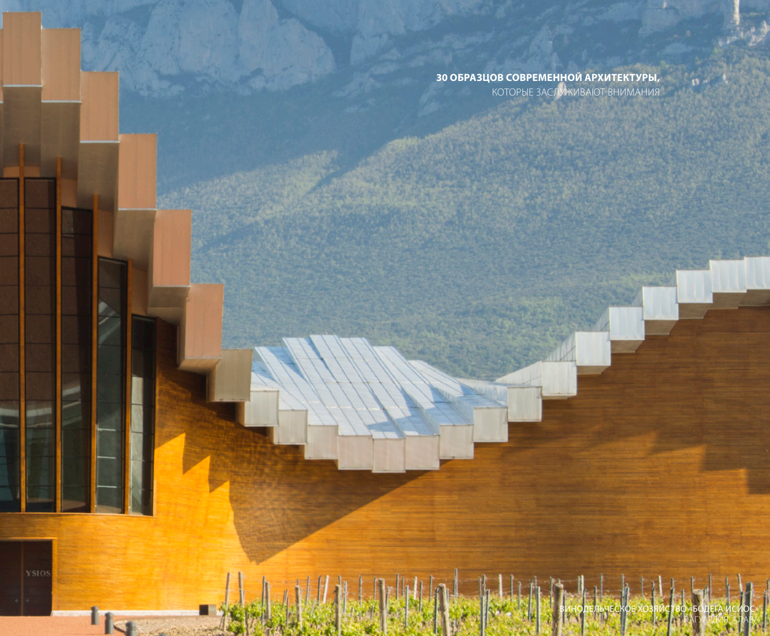
ВИНОДЕЛЬЧЕСКОЕ ХОЗЯЙСТВО «БОДЕГА ИСИОС» ЛАГУАРДИЯ, АЛАВА

Сооружение представляет собой адаптацию на современный лад традиционных строений, связанных с миром виноделия. Основу здания составляют выкопанные в земле погреба , сообщающиеся с теми, которые находятся там с незапамятных времен под склоном холма, где стоит замок Пеньяфьель.