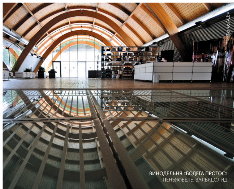
ВИНОДЕЛЬНЯ «БОДЕГА ПРОТОС» ПЕНЬЯФЬЕЛЬ, ВАЛЬЯДОЛИД

Самый привлекательный элемент винодельни — это крыша. Место, с которого лучше всего можно ее увидеть — это замок: анфилада из пяти элементов, крытых керамическими деталями крупного формата , по цвету и форме напоминающими традиционную местную черепицу.