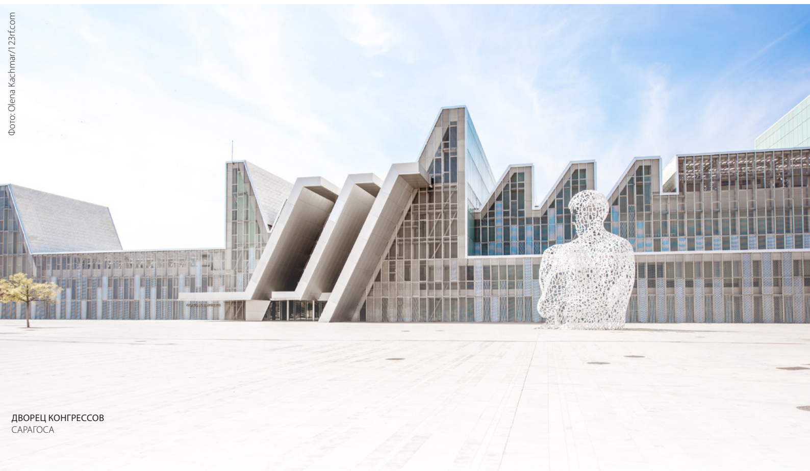
ДВОРЕЦ КОНГРЕССОВ САРАГОСА