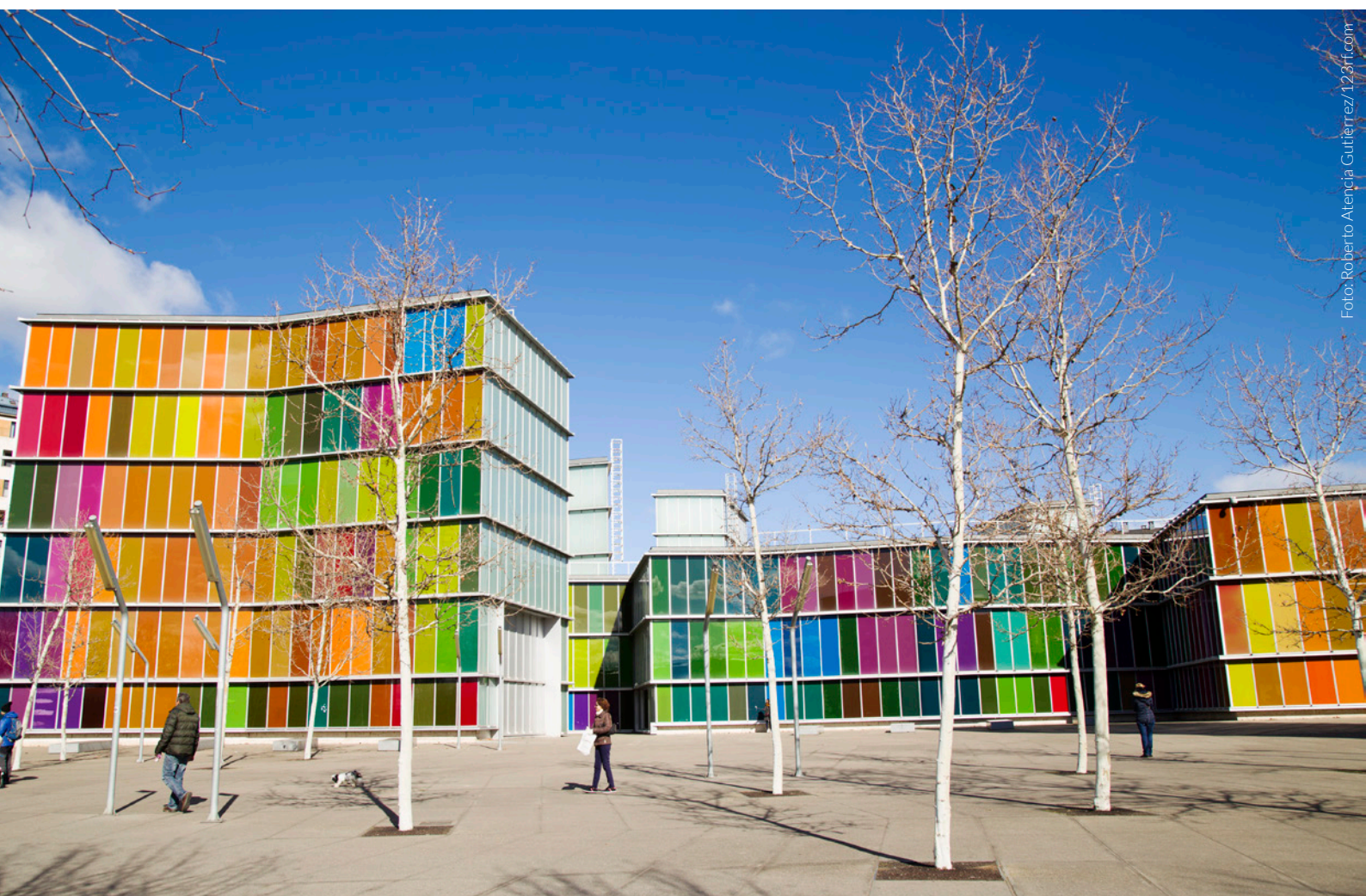
▲ MUSAC LEÓN