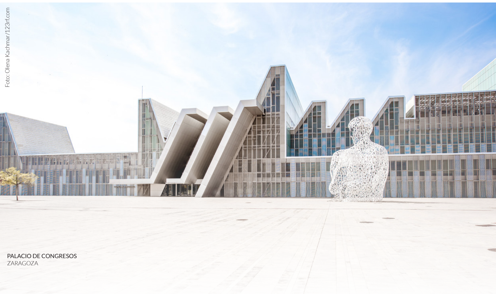
PALACIO DE CONGRESOS ZARAGOZA