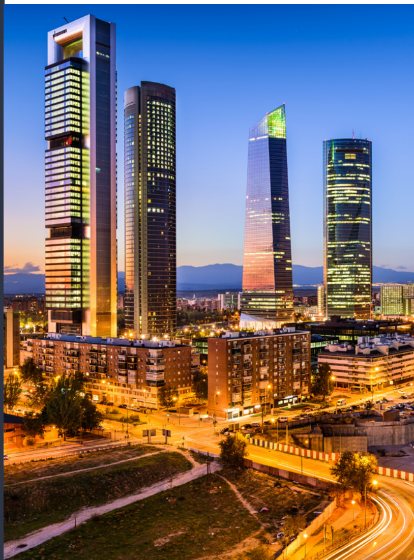
▲ COMPLEJO DE LAS CUATRO TORRES MADRID

Siente el vértigo de la Torre de Cristal , el edificio más alto de España, con 249 metros de altura . Fue construida por César Pelli , el mismo arquitecto que diseñó las célebres Torres Petronas de Kuala Lumpur, en colaboración con el estudio madrileño Ortiz León Arquitectos . Su fachada en forma de crystal tallado y el jardín vertical de su cúpula la hacen brillar como uno de los edificios más impactantes de la arquitectura madrileña.