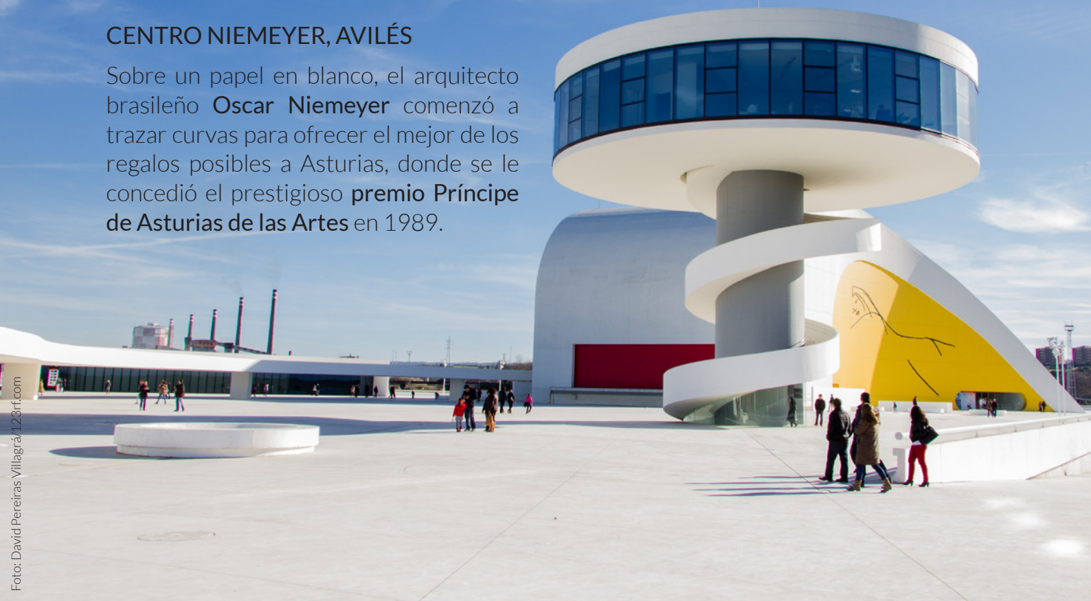
▲ CENTRO NIEMEYER AVILÉS