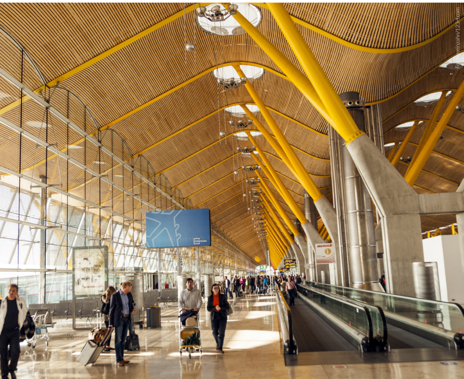
▼ TERMINAL 4 DEL AEROPUERTO DE MADRID-BARAJAS ADOLFO SUÁREZ MADRID

“Una celebración del viaje que captura la vida del ciudadano”, según Rogers, que puso en práctica su experiencia con la arquitectura bioclimática para su diseño vanguardista. Para potenciar la orientación del viajero, los pilares de la zona de embarque van cambiando de color, aportando una riqueza cromática que te sorprenderá.