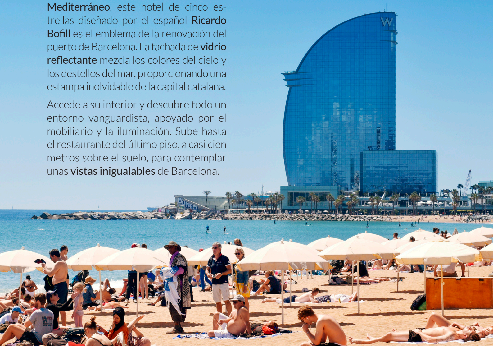
▲ W HOTEL BARCELONA

Accede a su interior y descubre todo un entorno vanguardista, apoyado por el mobiliario y la iluminación. Sube hasta el restaurante del último piso, a casi cien metros sobre el suelo, para contemplar unas vistas inigualables de Barcelona.