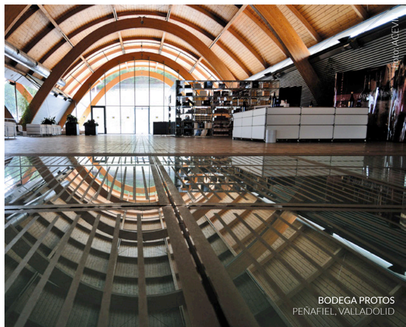
BODEGA PROTOS PEÑAFIEL, VALLADOLID

El elemento visual más llamativo de la bodega es su cubierta. Desde donde mejor se aprecia es precisamente desde las alturas del castillo: cinco crujías cubiertas por piezas cerámicas de gran formato , que recuerdan al color y la forma de las tejas tradicionales de la zona.