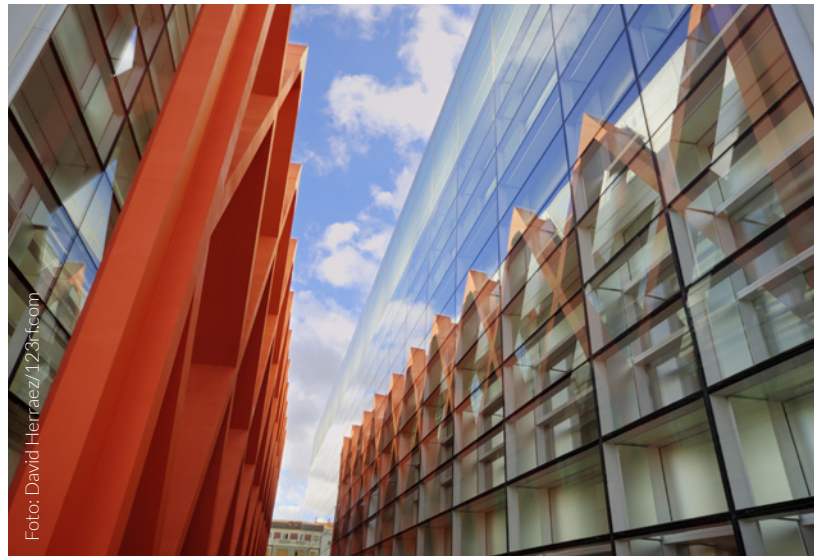
▲ MUSEUM DER EVOLUTIONSGESCHICHTE DES MENSCHEN BURGOS

Beim Betreten des Hauptgebäudes stellt sich bei Ihnen sogleich ein Ge-