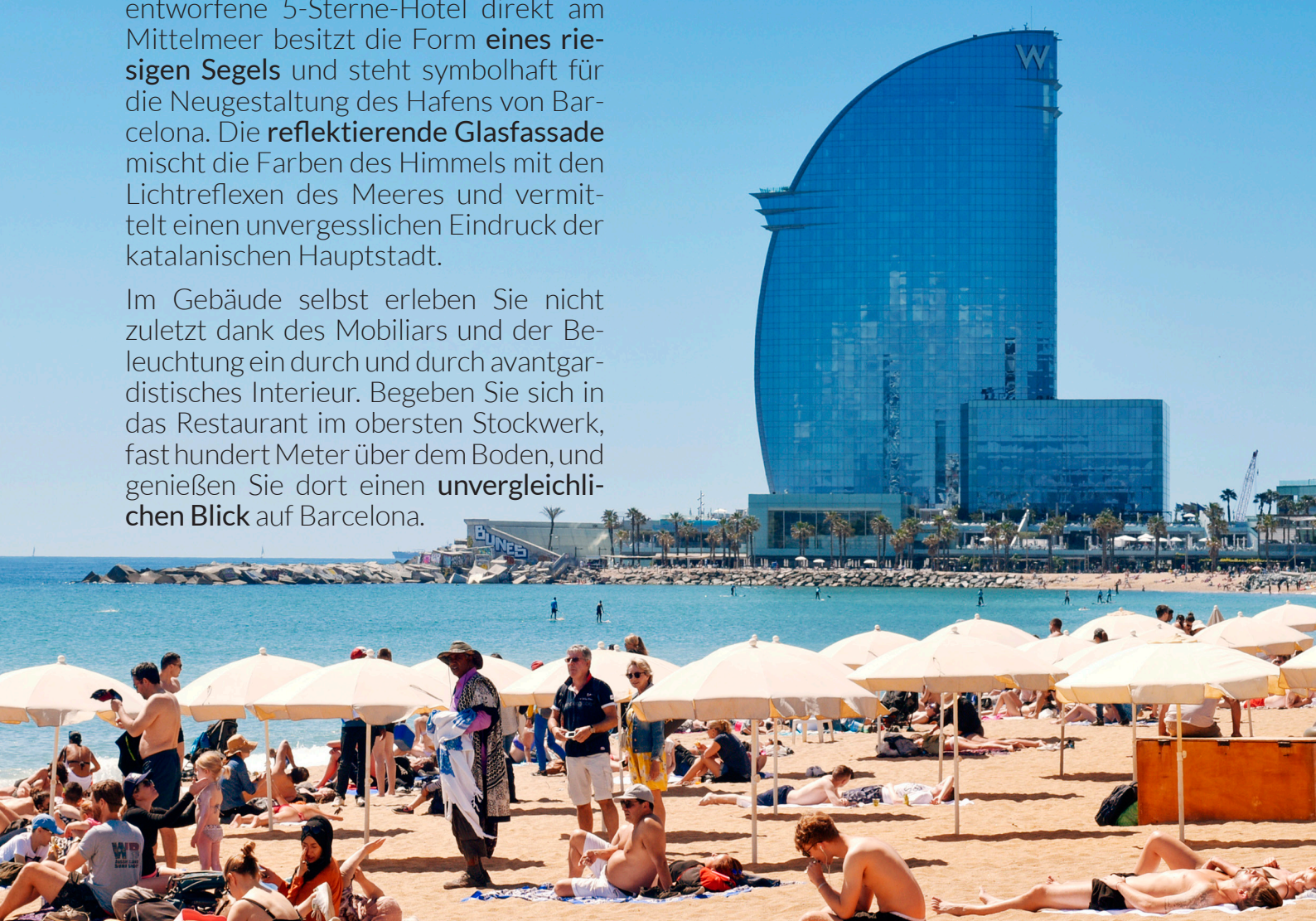
▲ W HOTEL BARCELONA

Im Gebäude selbst erleben Sie nicht zuletzt dank des Mobiliars und der Beleuchtung ein durch und durch avantgardistisches Interieur. Begeben Sie sich in das Restaurant im obersten Stockwerk, fast hundert Meter über dem Boden, und genießen Sie dort einen unvergleichlichen Blick auf Barcelona.