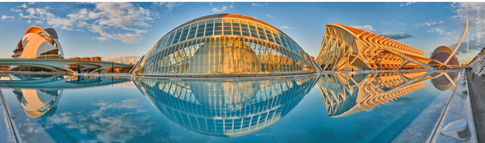
▲ STADT DER KÜNSTE UND WISSENSCHAFTEN VALENCIA