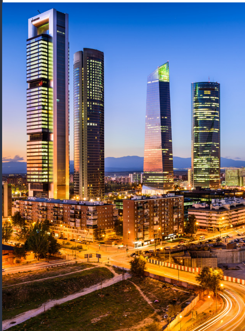
▲ BUSINESSKOMPLEX LAS CUATRO TORRES MADRID

Erleben Sie das Gefühl des Schwindels, das der Torre de Cristal (Glasturm) verursacht, das mit einer Höhe von 249 Metern höchste Gebäude Spaniens. Es wurde von dem Architekten César Pelli , der auch die berühmten Petronas Towers in Kuala Lumpur entworfen hat, in Zusammenarbeit mit dem Madrider Architekturbüro Ortiz León erbaut. Seine wie geschliffenes Glas anmutende Fassade und der vertikale Garten seiner Kuppel lassen dieses Hochhaus als eines der eindrucksvollsten Gebäude der Madrider Architektur erstrahlen