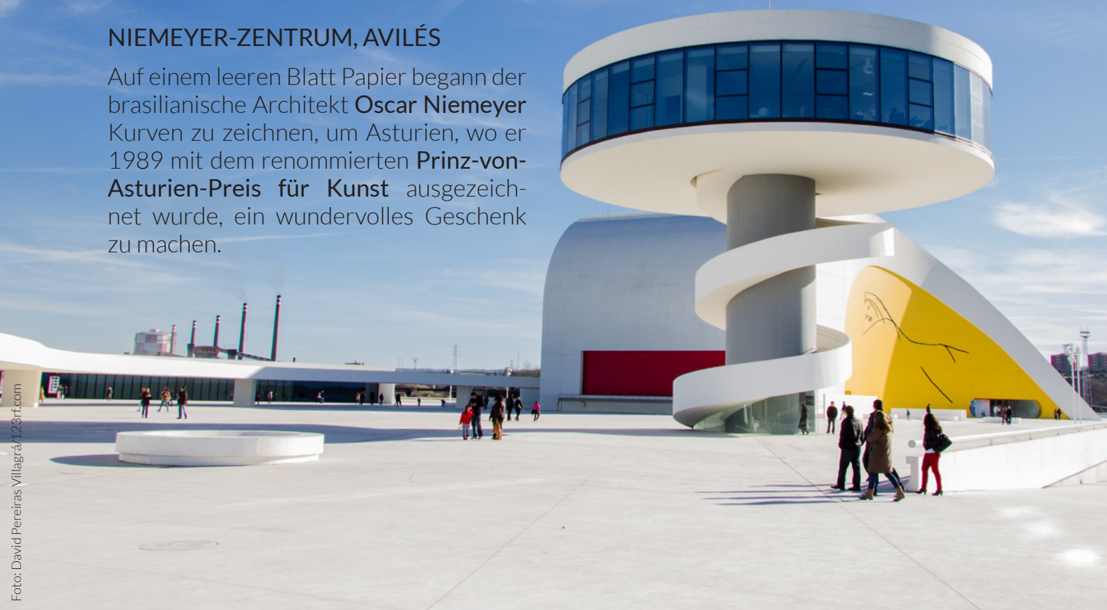
▲ NIEMEYER-ZENTRUM AVILÉS