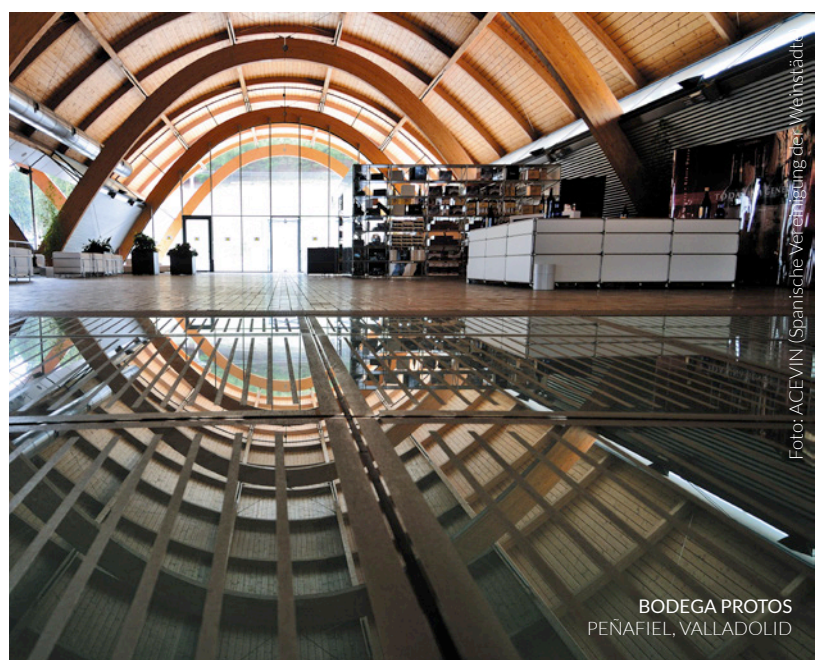
BODEGA PROTOS PEÑAFIEL, VALLADOLID

Das auffälligste optische Element der Weinkellerei ist ihr Dach. Am besten sieht man es von dem erhöhten Standort der Burg aus: fünf Gänge, die mit großformatigen Keramikstücken abgedeckt sind , die an die Farbe und Form der traditionellen Dachpfannen der Gegend erinnern.