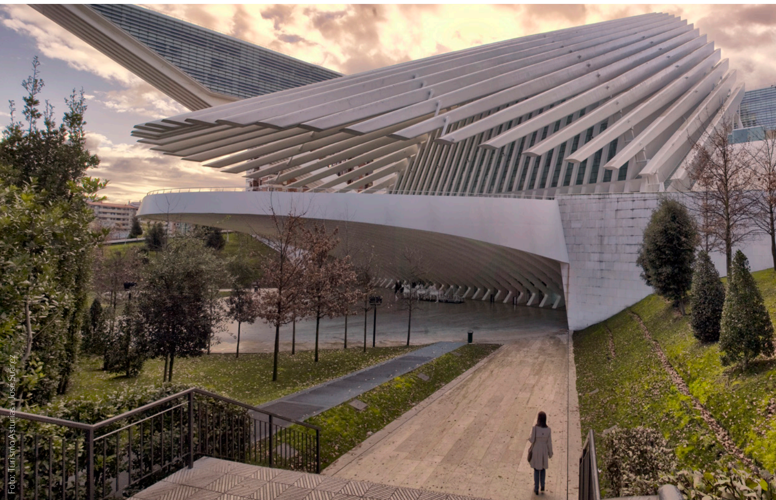
▲ KONGRESSPALAST OVIEDO