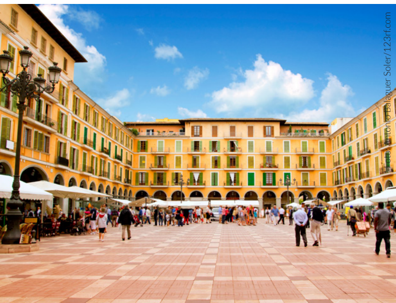
▲ PLAZA MAYOR PALMA DE MALLORCA

vinculados con la obra de este genio del surrealismo. También puedes entrar en el Museo Fundación Juan March y admirar su colección de artistas españoles del siglo XX, con obras de Picasso, Juan Gris o Salvador Dalí.