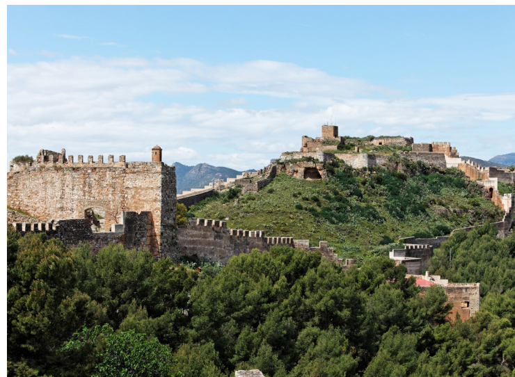
▲ SAGUNTO VALENCIA

Si algo no puede faltar para completar tu viaje son las compras. En el pintoresco barrio del Carmen podrás encontrar artículos de recuerdo, productos gastronómicos, diseños de alta costura, exclusivas piezas de porcelana o calzado diseñado y fabricado en la propia región.