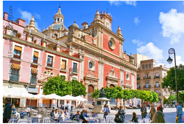
▲ PLAZA DEL SALVADOR, SEVILLA

defensivo que estuvo revestida de azulejos dorados, de ahí su nombre. En su interior te aguarda el Museo Naval , con maquetas, brújulas y antiguas cartas de navegación.