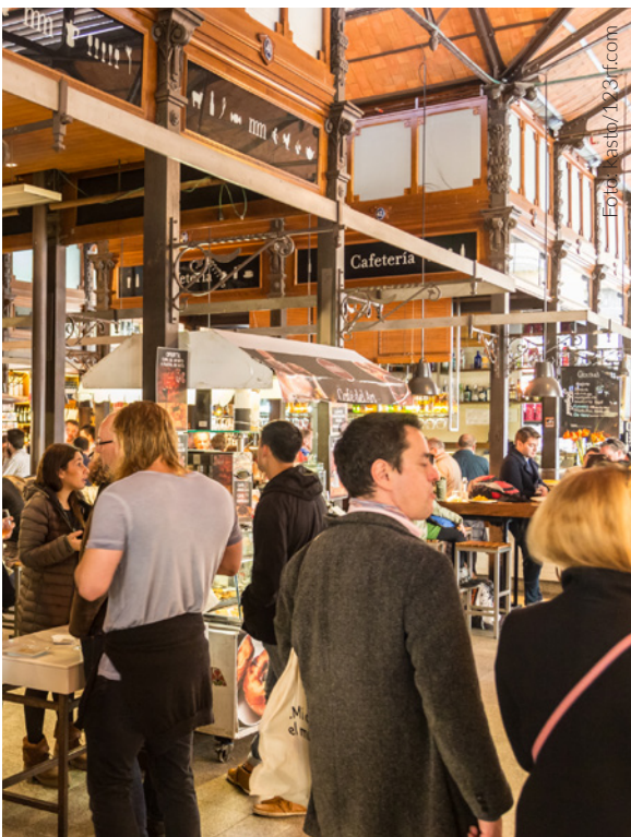
▲ MERCADO DE SAN MIGUEL MADRID

Si lo que buscas son grandes espectáculos, disfruta de una noche perfecta asistiendo a un musical en la Gran Vía, o vibra con una de las óperas que se representan en el Teatro Real .