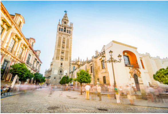
▲ CATEDRAL DE SEVILLA