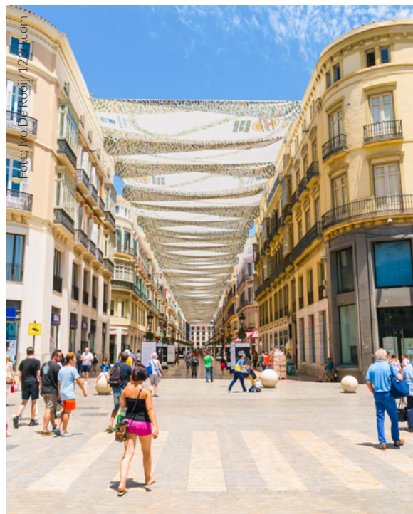
▲ CALLE MARQUÉS DE LARIOS MÁLAGA

Completa la mañana con un plan cultural en alguno de los muchos museos que Málaga pone a tu disposición. La ciudad en la que nació el genial Picasso guarda muy vivo el recuerdo de uno de los artistas clave del siglo XX. El palacio de Buenavista acoge la colección del Museo Picasso , que repasa ocho décadas de su producción artística.