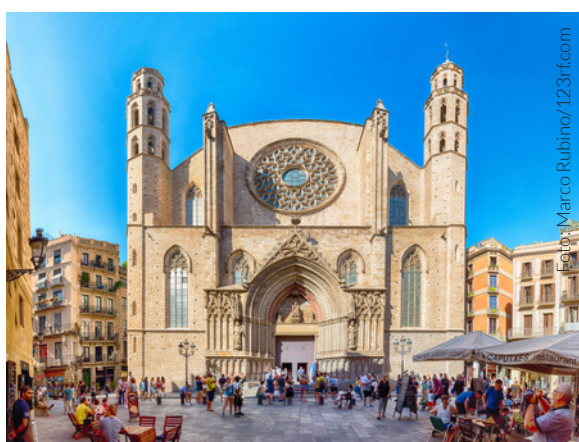
▲ PLAZA E IGLESIA DE SANTA MARÍA DEL MAR BARCELONA

Recorre el corazón ancestral de Barcelona en el barrio Gótico . Sus calles estrechas y construcciones medievales te transportarán en el tiempo. Admira los palacios del Ayuntamiento y de la Generalitat , la catedral o la basílica gótica de Santa María del Pi .