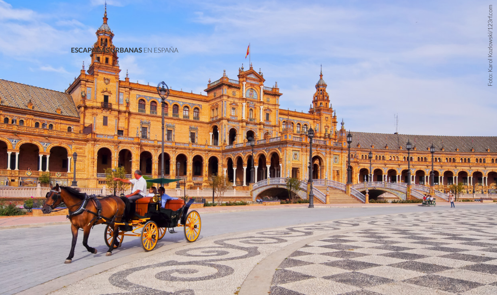
▲ PLAZA DE ESPAÑA SEVILLA

Después, encamina tus pasos hacia la antigua Real Fábrica de Tabacos , donde se recibía y manufacturaba el tabaco procedente de las Américas. Es uno de los edificios más bonitos de la ciudad y hoy en día está ocupado por la sede principal de la Universidad de Sevilla.