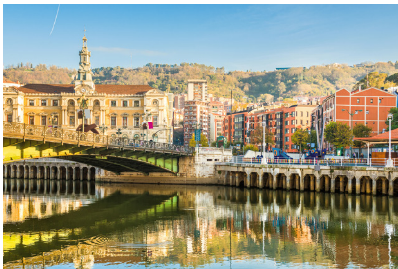
▲ CENTRO HISTÓRICO BILBAO

Desde el monumental teatro Arriaga , cruza por el punte de Zubia para continuar una ruta gastronómica por el Ensanche . Destacan los succulentos bares de pintxos de las calles Gran Vía, Albia y plaza Circular. Es una de las zonas más comerciales y culturales de Bilbao, con cientos de tiendas, cafés y salas de teatro.