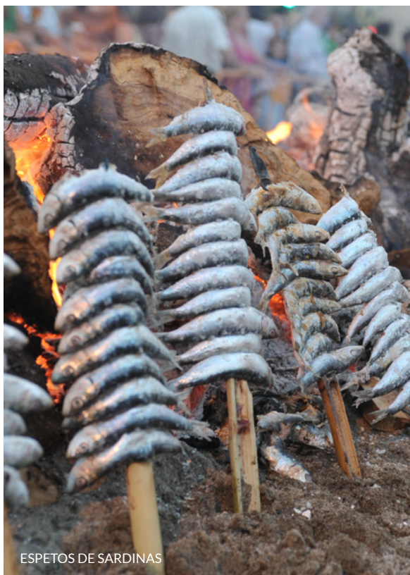
ESPETOS DE SARDINAS