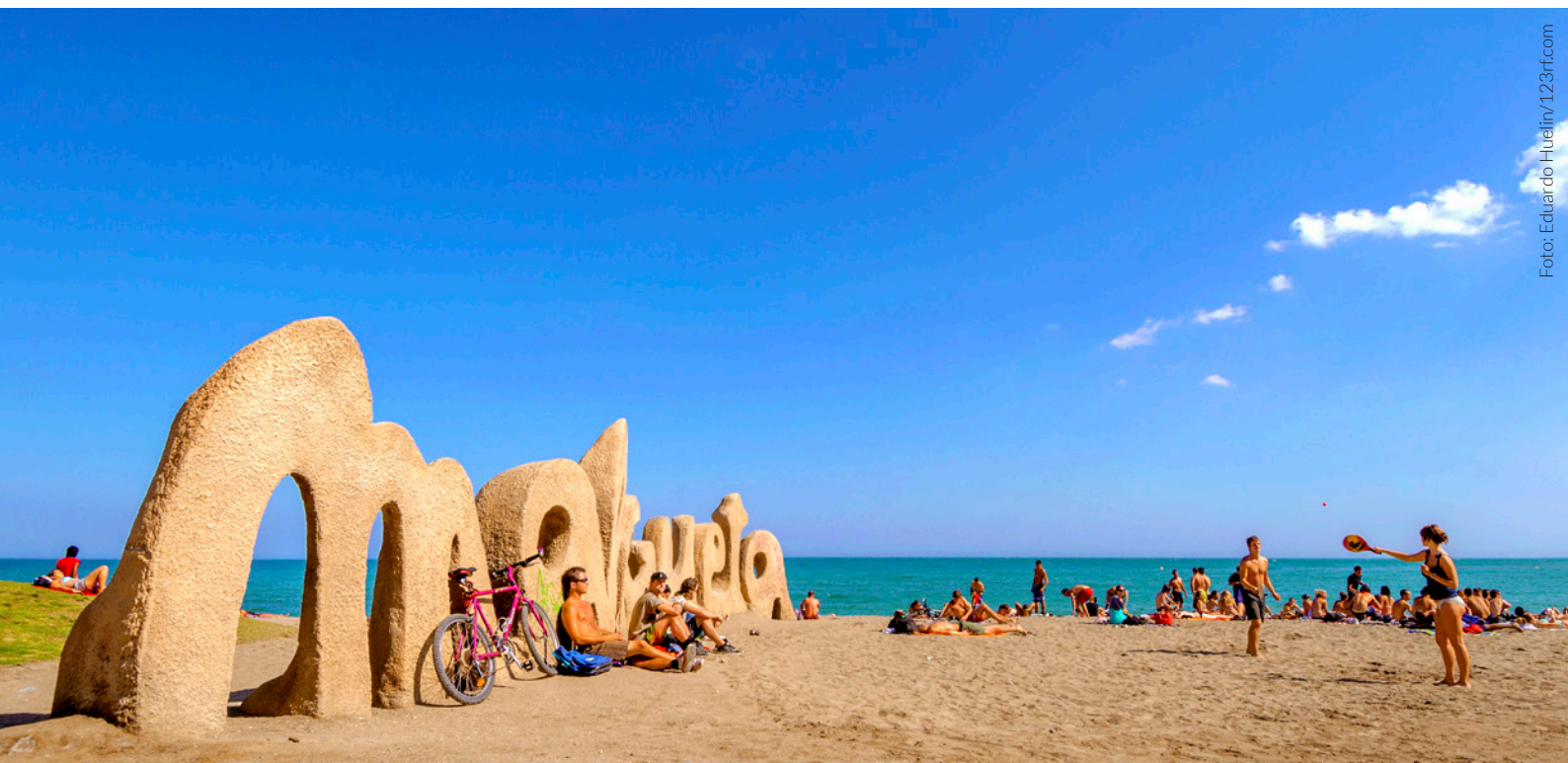
▲ PLAYA DE LA MALAGUETA MÁLAGA