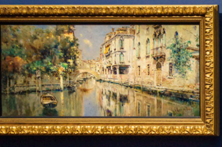
El río de Sevilla de Joaquín Sorolla Museo de Málaga