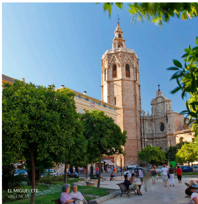
EL MIGUELETE VALENCIA