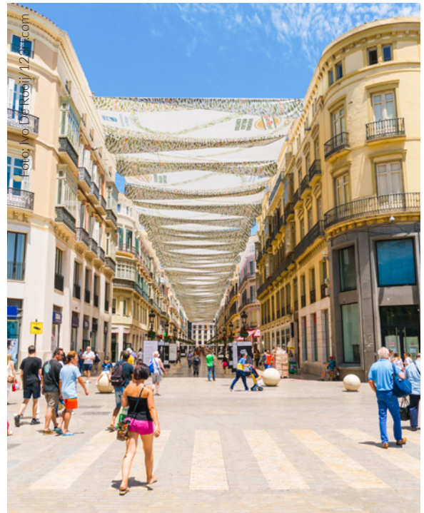
▲ CALLE MARQUÉS DE LARIOS MÁLAGA

Vervollständigen Sie den Vormittag mit ein bisschen Kultur in einem der vielen Museen, die Málaga zu bieten hat. Die Geburtsstadt Picassos hält die Erinnerung an einen der wichtigsten Künstler des 20. Jahrhunderts wach. Der Palast von Buenavista beherbergt die Sammlung des Picasso-Museums , die acht Jahrzehnte seines künstlerischen Schaffens Revue passieren lässt.