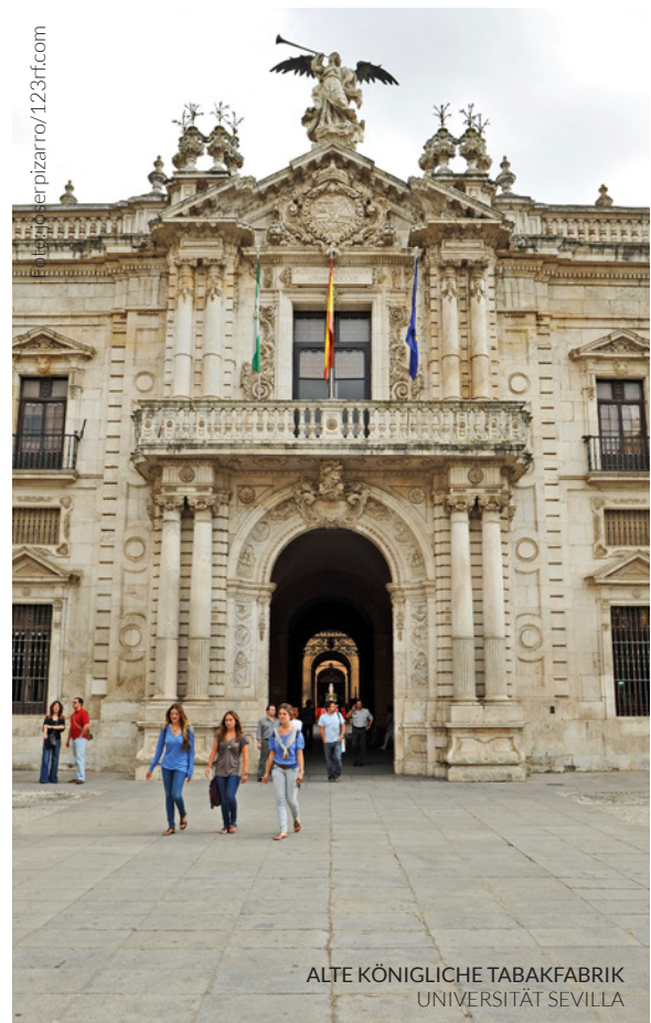
ALTE KÖNIGLICHE TABAKFABRIK UNIVERSITÄT SEVILLA

Genießen Sie die Sonne und die Atmosphäre der Alameda de Hercules , während Sie dort zu Mittag essen. Die Umgebung von Europas ältester öffentlicher Gartenanlage hat sich in den letzten Jahren mit Tapas-Bars, charmanten Cafés und erstklassigen Restaurants gefüllt.