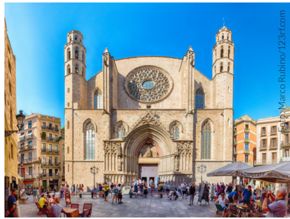
▲ PLATZ UND KIRCHE SANTA MARÍA DEL MAR BARCELONA

Schlendern Sie durch das historische Zentrum von Barcelona, das Barri Gòtic . Seine engen Gassen und mittelalterlichen Gebäude werden Sie in die Vergangenheit zurückversetzen. Bewundern Sie die Paläste der Stadtverwaltung und der Generalitat , die Kathedrale oder die gotische Basilika Santa María del Pi .