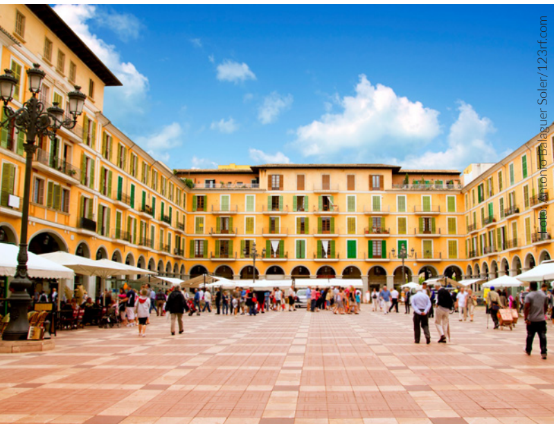
▲ PLAZA MAYOR PALMA DE MALLORCA

Oder Sie besuchen das Museum der Stiftung Juan March mit seiner Sammlung spanischer Künstler des 20. Jahrhunderts mit Werken von Picasso, Juan Gris und Salvador Dalí.