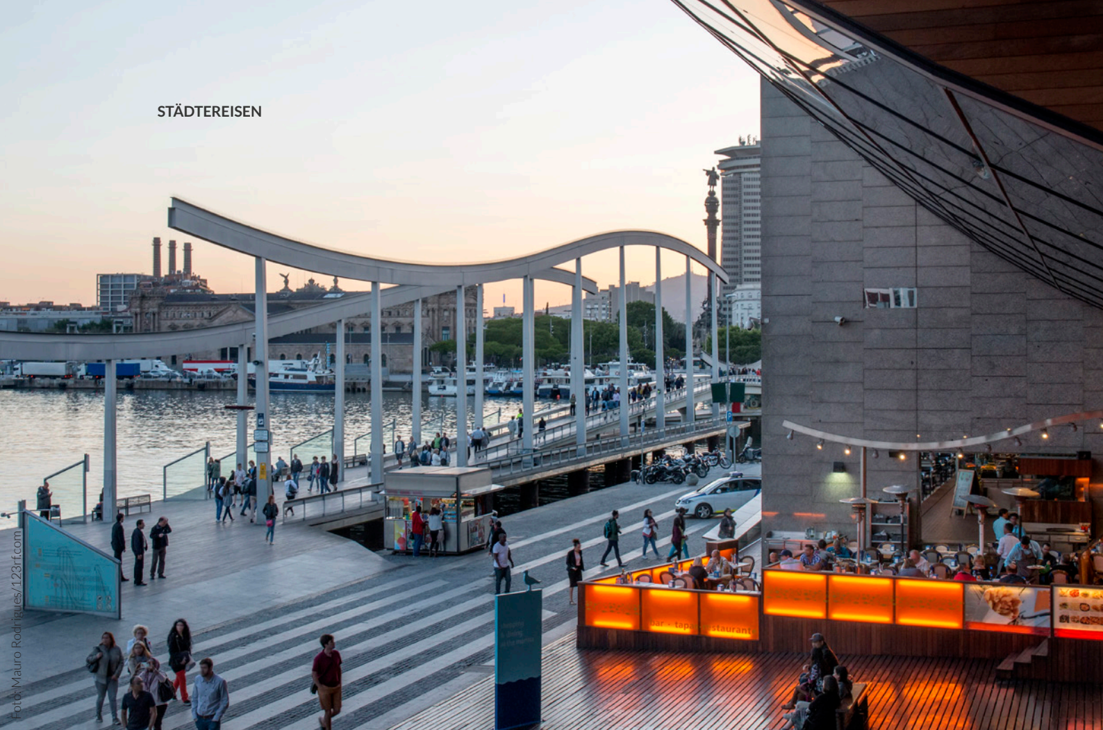
▲ PORT VELL BARCELONA

Am frühen Mittag schlagen wir Ihnen eine gastronomische Route durch den Stadtteil Ciutat Vella vor. Genießen Sie die lebendige Atmosphäre der Markthalle Santa Caterina mit ihrem bunten Dach. Probieren Sie die exquisiten Gerichte einiger Stände und typische Produkte der katalanischen Esskultur wie z.B. Butifarra-Wurst oder Brot mit Tomate.