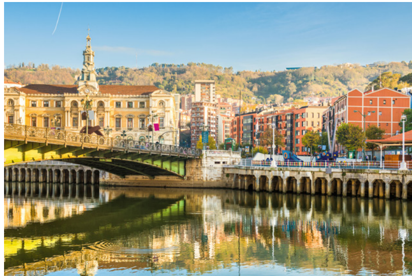
▲ HISTORISCHER STADTKERN BILBAO

Überqueren Sie am monumentalen Arriaga-Theater die Zubia-Brücke , um Ihre gastronomische Tour durch das Ensanche fortzusetzen. Besondere Aufmerksamkeit verdienen die ausgezeichneten Pintxos -Bars auf der Gran Vía, der Calle Albia und der Plaza Circular. Mit Hunderten von Geschäften, Cafés und Theatern ist dies eine der kommerziellsten und kulturell lebendigsten Gegenden von Bilbao.