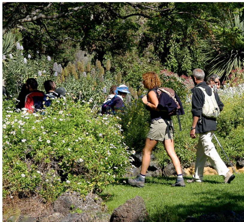
▼ JARDIN BOTANIQUE DES CANARIES VIERA Y CLAVIJO LAS PALMAS DE GRAN CANARIA