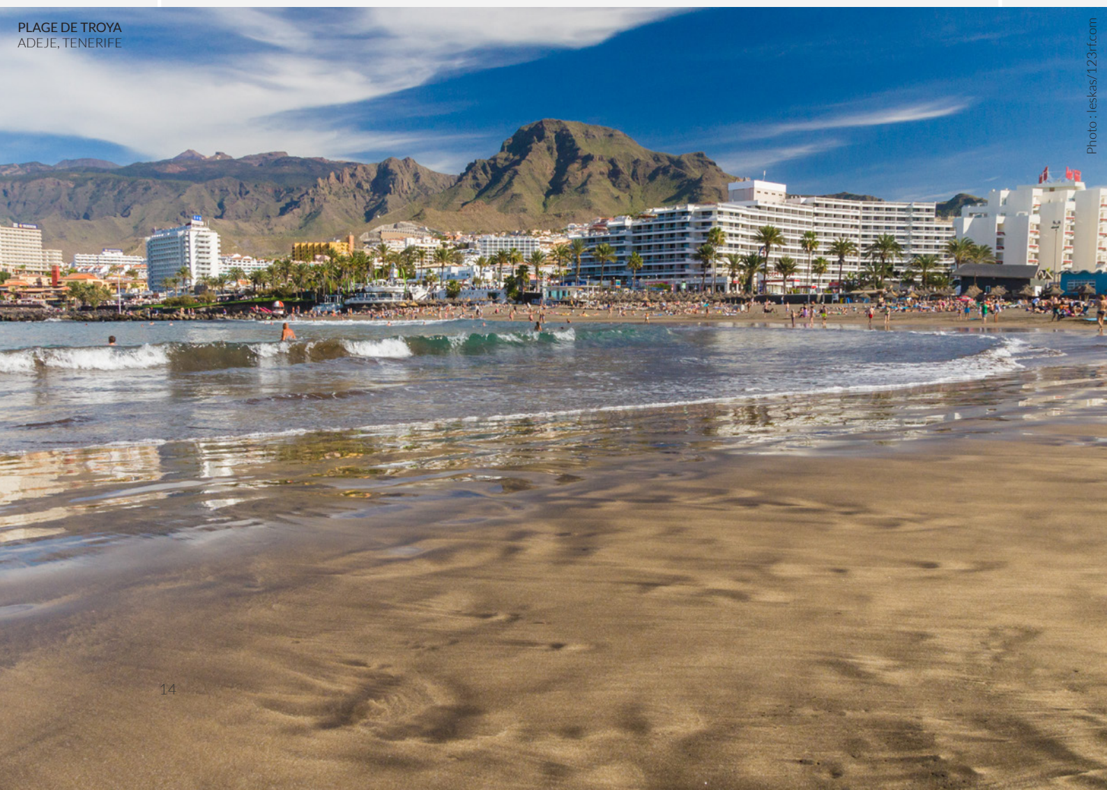
PLAGE DE TROYA ADEJE, TENERIFE

📍 Pour en savoir plus : www.webtenerife.com