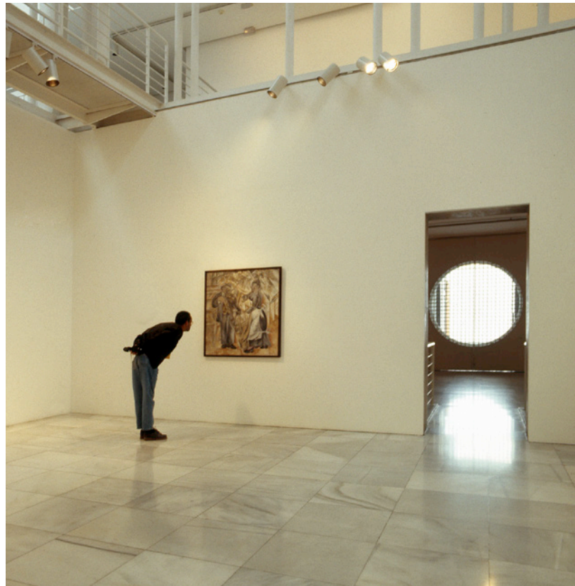
▲ CENTRE ATLANTIQUE D'ART MODERNE, CAAM LAS PALMAS DE GRAN CANARIA

Autres merveilles en plein air : au jardin botanique Viera y Clavijo , vous en apprendrez davantage sur la flore des