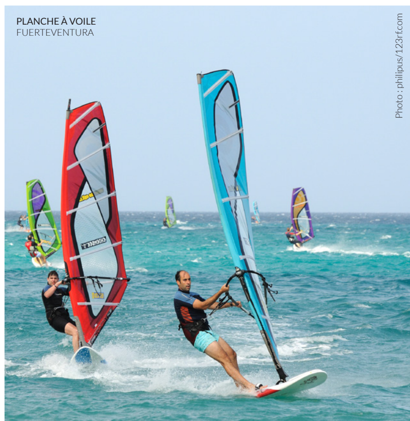
PLANCHE À VOILE FUERTEVENTURA