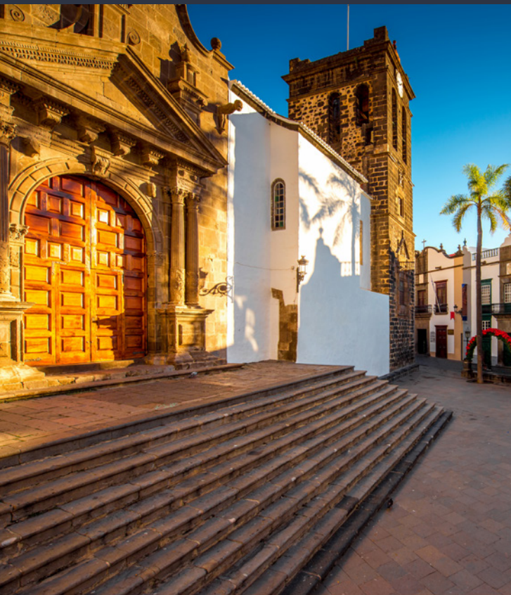
▲ ÉGLISE EL SALVADOR SANTA CRUZ DE LA PALMA

La « isla bonita » (la belle île) est la plus verte de l'archipel. Elle vaut la peine d'être visitée, rien que pour ses bois préhistoriques de « laurisilva » et pour ses conditions astronomiques, qui permettent d'observer les étoiles sous l'un des plus beaux ciels du monde. Classée réserve de la biosphère dans sa totalité, il y a plusieurs manières de la parcourir, mais le mieux est de le faire à pied. Ses sentiers sont conçus pour tous les aventuriers et vous mèneront à des endroits incroyables.