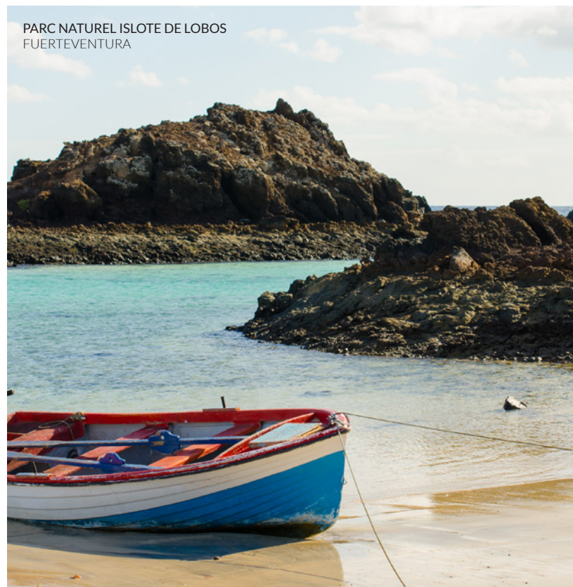
PARC NATUREL ISLOTE DE LOBOS FUERTEVENTURA

Au large, les vents et les vagues de Fuerteventura sont parfaits pour s'entraîner à la planche à voile. La plongée se pratique à tous les niveaux, notamment sur les plages de la péninsule de Jandía et à la Caleta de Fuste . Voile, surf, ski nautique ou pêche sont d'autres sports possibles ici (si vous aimez les sensations fortes, osez la pêche au marlin).