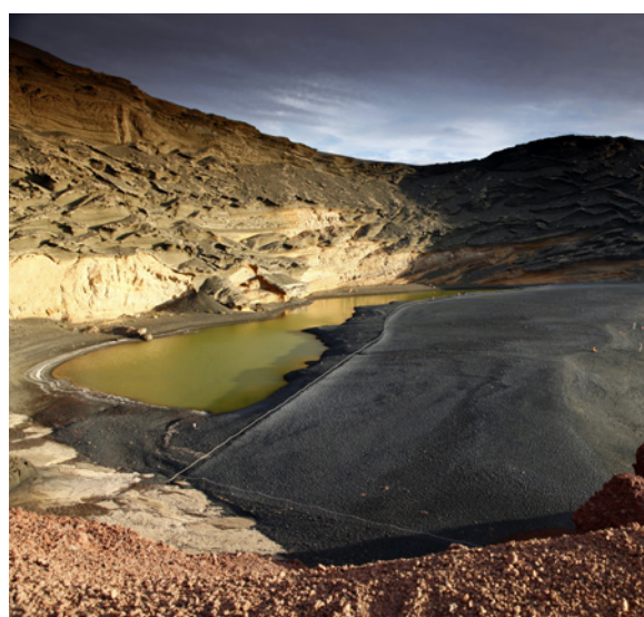
▲ CHARCO DE LOS CLICOS LANZAROTE

Explorez la lagune de Janubio et grimpez au belvédère pour contempler les salines. Au Charco de los Clicos , réserve de la biosphère, vous découvrirez un incroyable lac vert sur un cratère volcanique.