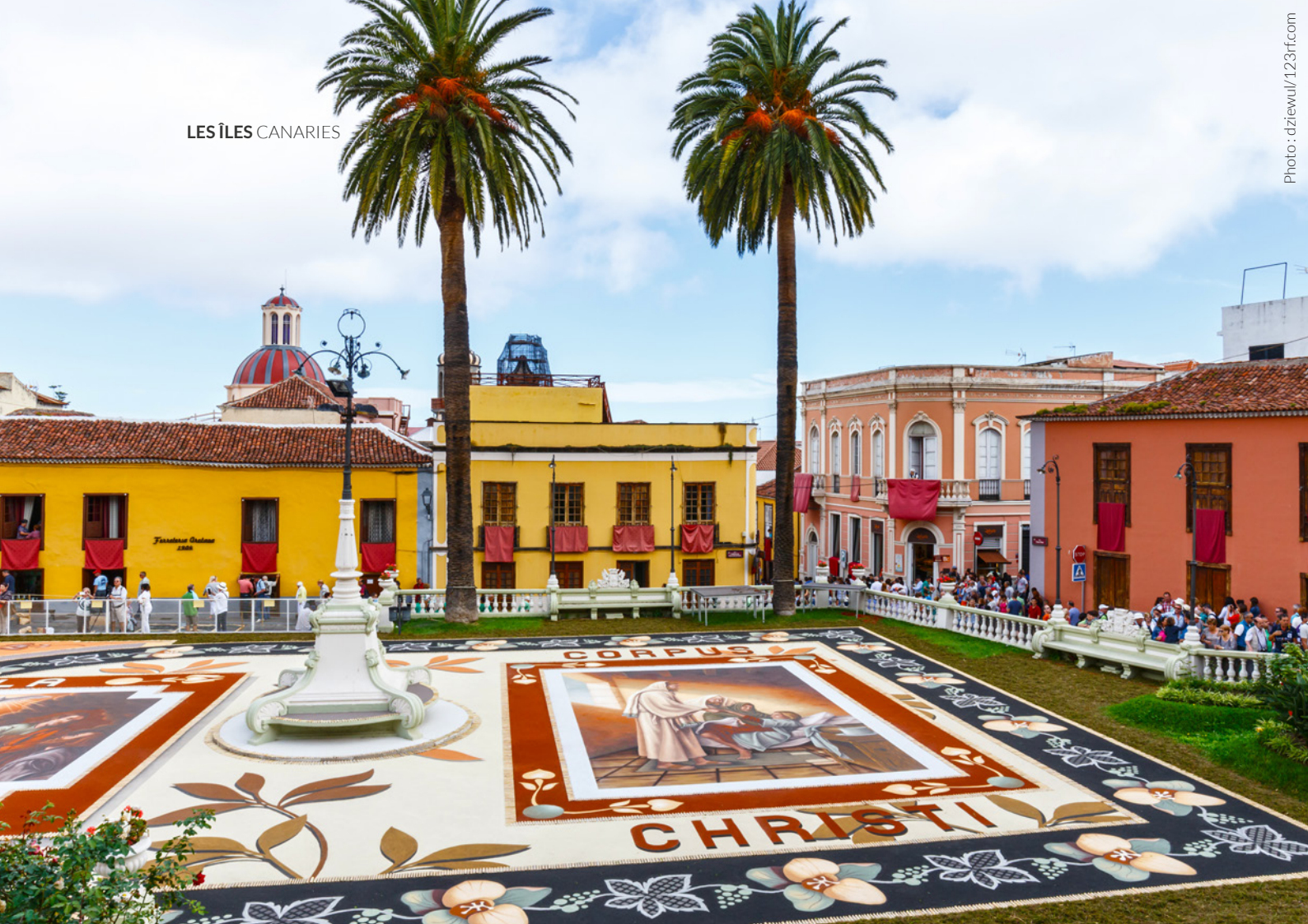
▲ TAPIS DE LA FÊTE-DIEU LA OROTAVA, TENERIFE

Une excursion fascinante vous mènera dans la ville de Candelaria , à l'atmosphère maritime et populaire. La basilique est sa construction la plus emblématique. En juillet et août a lieu la fête patronale , avec ses beaux pèlerinages et des dépôts de gerbes florales en hommage à la patronne de la ville, la Vierge de la Candelaria.