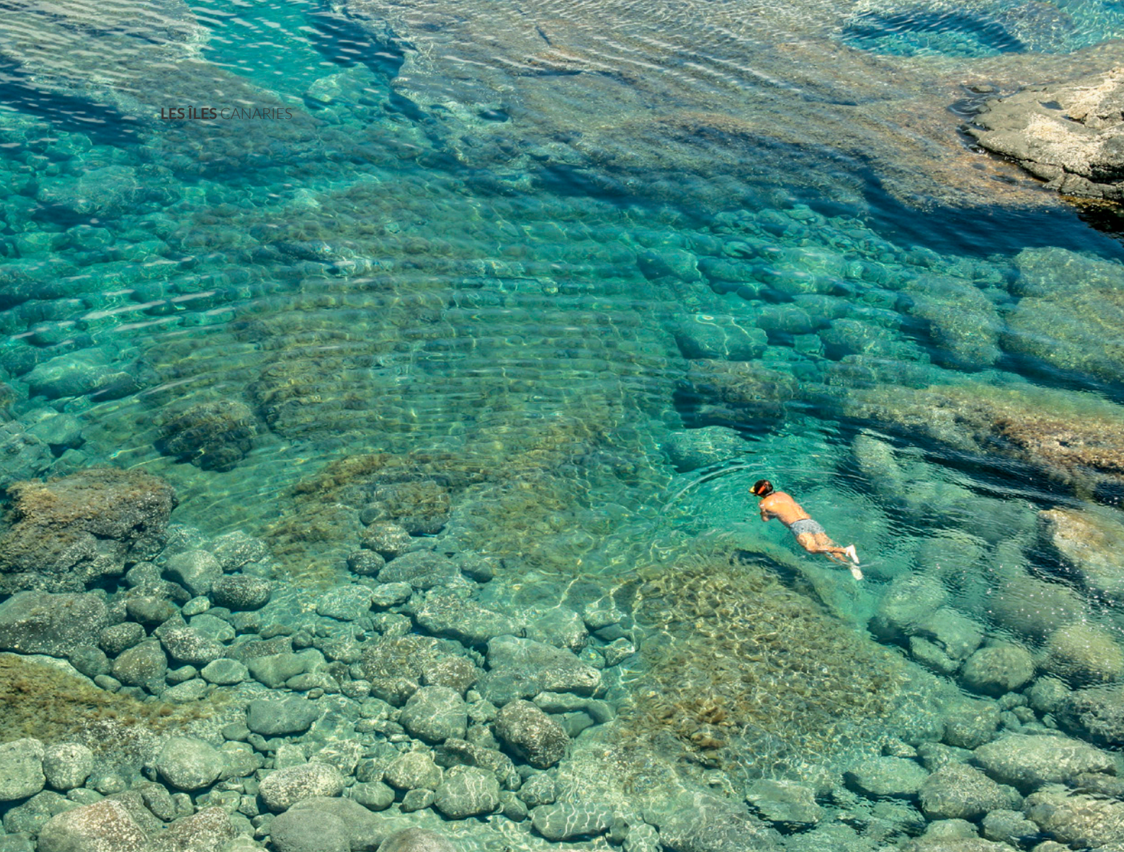
▲ PISCINES NATURELLES DES CHARCONES LANZAROTE