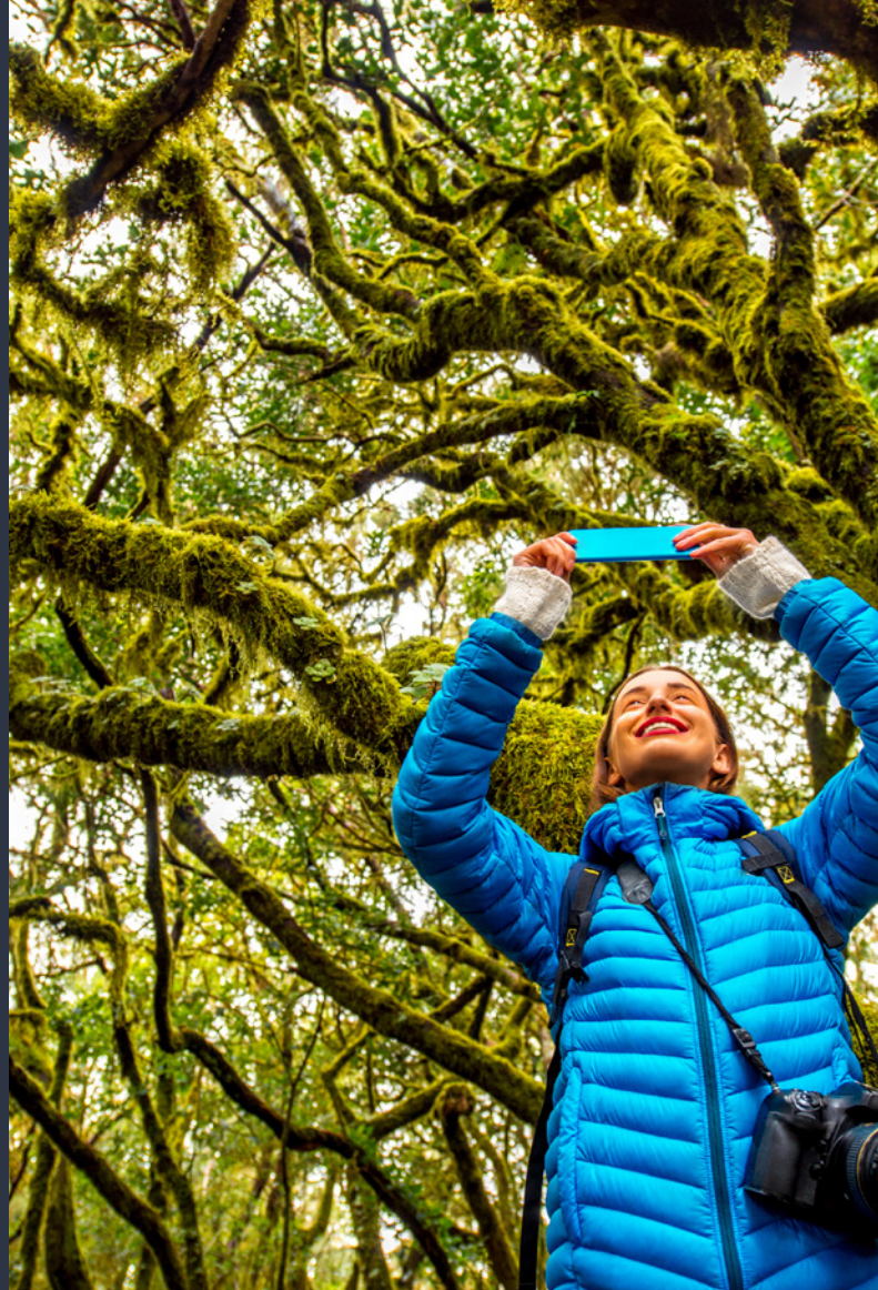
▲ PARC NATIONAL DE GARAJONAY LA GOMERA

Baignez-vous sur des plages surplombées de falaises et admirez Los Órganos , au nord, où vous entendrez la musique du vent dans les rochers. Dans la vallée du Rey vous attendent des hameaux de maisons blanches entre les palmiers. Vous pouvez aussi visiter le charmant village d' Agulo . Vous n'oublierez pas de sitôt l'image de ses maisons de conte de fées colorées.