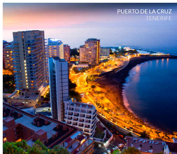
PUERTO DE LA CRUZ TENERIFE

église Nuestra Señora de la Peña de Francia , entourée de jardins. Elle est située au cœur de la ville, près de la place du Charco et de la promenade maritime .