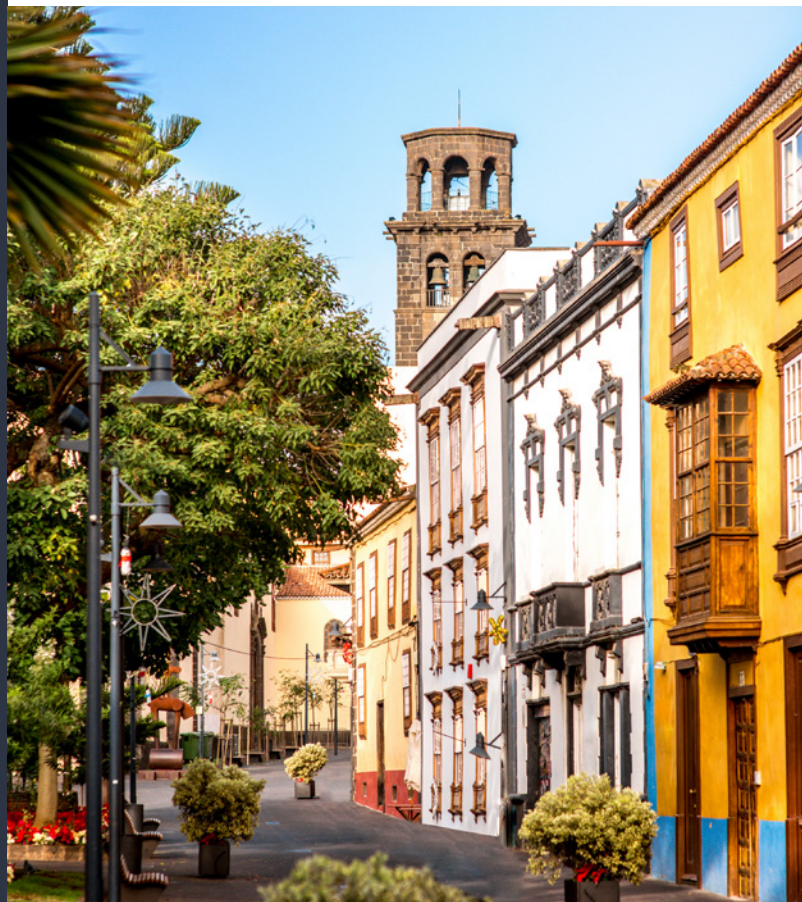
▲ SAN CRISTÓBAL DE LA LAGUNA TENERIFE

Sur la côte et à l'intérieur de l'île, vous trouverez de jolis villages et fermes entourés du calme des montagnes où sont encore bien vivantes les traditions locales. Le sud est particulièrement célèbre pour ses grands resorts de vacances, ses parcs thématiques et sa vie nocturne animée. Son carnaval est également célèbre, c'est une véritable explosion de paillettes, de couleurs et de musique.