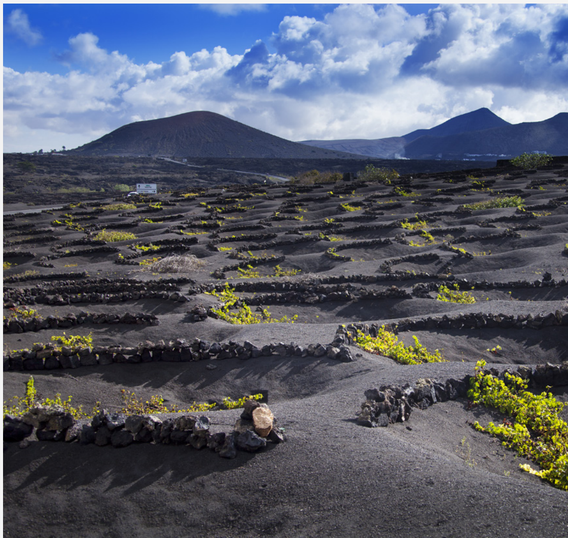
▲ LA GERIA LANZAROTE

Sur les îles fortunées vous savourez de délicieux poissons et fruits de mer , comme la vieja (poisson-perroquet méditerranéen), le mérrou ou le cernier commun. Les Canaries sont aussi un éden fruitier, où la banane occupe la première place. Savourez les 10 vins d'appellation d'origine produits sur l'archipel et goûtez les différents fromages , notamment le majorero , un bijou culinaire de Fuerteventura élaboré avec du lait de