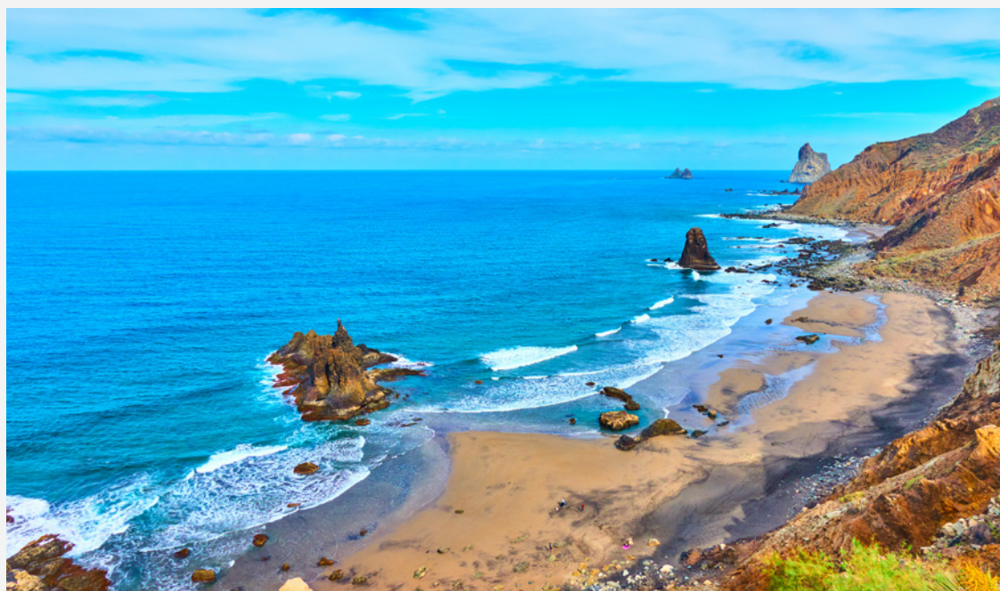
▲ PLAGES DE BENIJO TENERIFE

plus touristique, vous apprécierez ses plages tranquilles de sable blanc et de superbes endroits proposant des sports nautiques et plusieurs options de loisirs, avec des établissements sur la plage ouverts de jour comme de nuit.