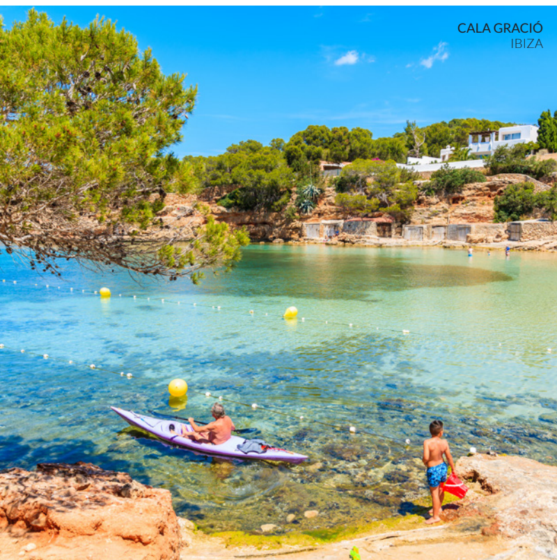
CALA GRACIÓ IBIZA