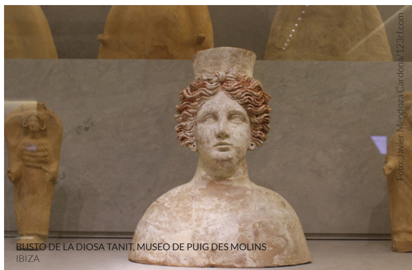
BUSTO DE LA DIOSA TANIT, MUSEO DE PUIG DES MOLINS IBIZA