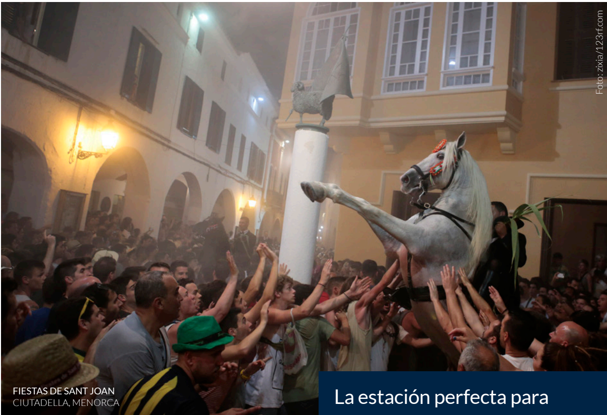
FIESTAS DE SANT JOAN CIUTADELLA, MENORCA