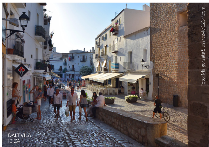
DALT VILA IBIZA