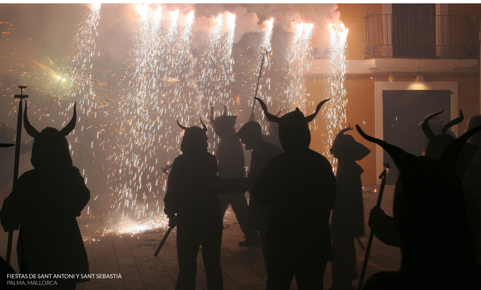
FIESTAS DE SANT ANTONI Y SANT SEBASTIÀ PALMA, MALLORCA