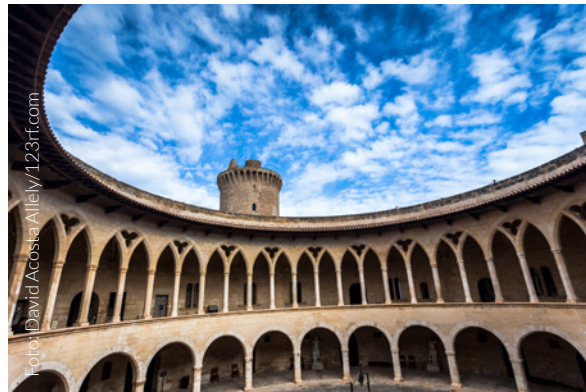
▲ CASTILLO DE BELLVER, PALMA MALLORCA

Si quieres contemplar la isla desde un lugar privilegiado, a unos 3 kilómetros del centro histórico te encontrarás con el castillo de Bellver , de estilo gótico, uno de los pocos en Europa con planta circular.