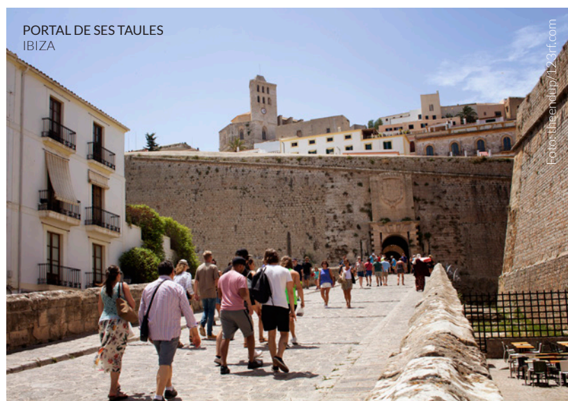
PORTAL DE SES TAULES IBIZA

Súmate al turismo creativo, una nueva tendencia que se extiende por diversas ciudades del mundo: participa en atractivas actividades, como talleres de música, baile, fotografía, idiomas o cocina.