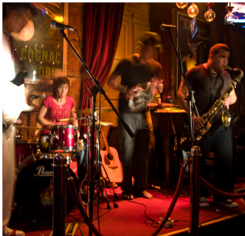
▲ FESTIVAL JAZZ OBERT MENORCA

Los deportistas tienen en estos meses una atractiva agenda, como Formentera to run , una carrera de sesenta kilómetros por los rincones más hermosos de la isla (a finales de mayo y principios de junio). También pueden participar en la travesía a nado Formentera-Ibiza Ultraswim , una travesía de 30 km entre ambas islas, combinada con dos más de 5 km y 750 m, que suele celebrarse en mayo.