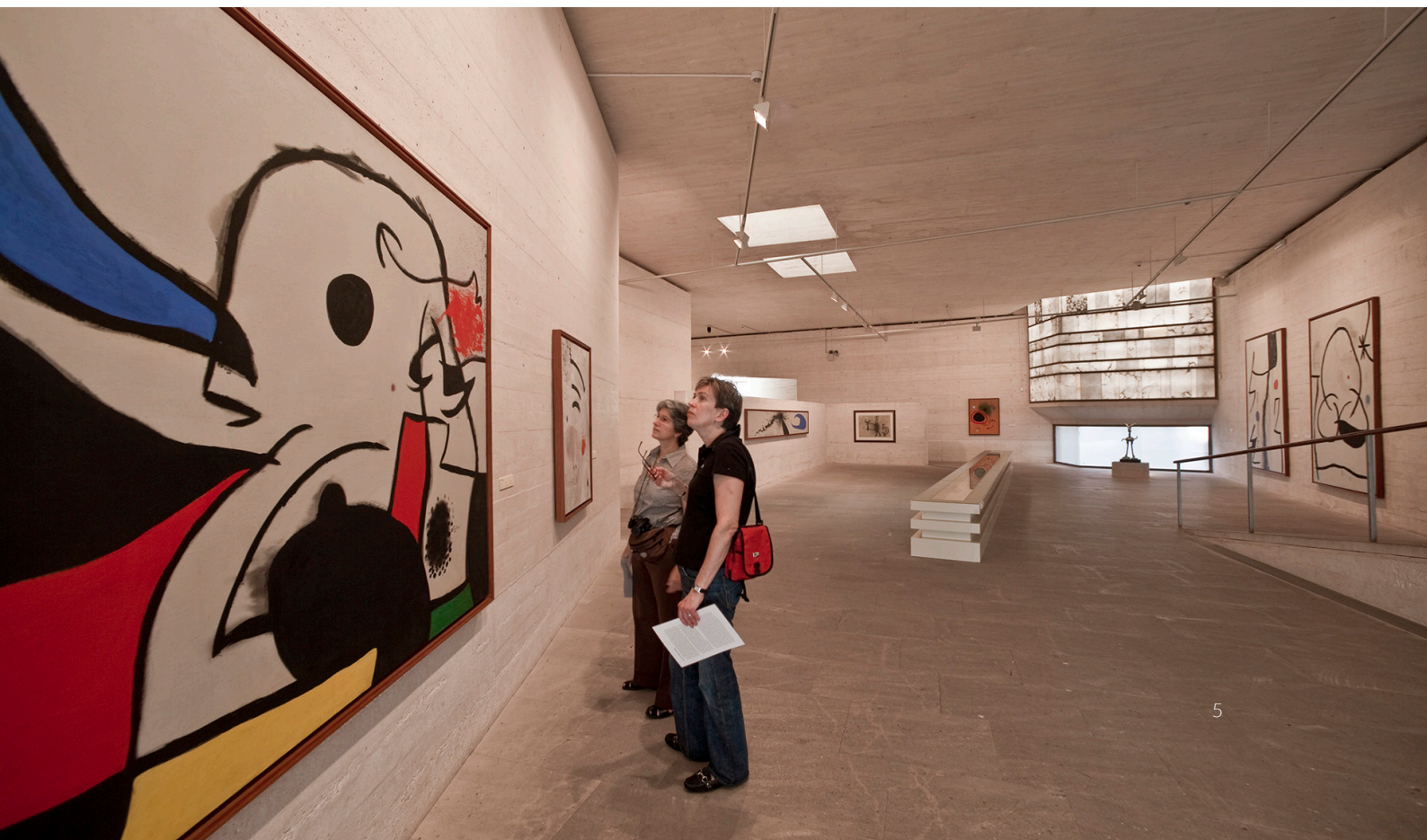
▼ FUNDACIÓN PILAR Y JOAN MIRÓ MALLORCA

Por último, remóntate a la prehistoria en los conjuntos talayóticos , poblados de los primeros habitantes del archipiélago. En la localidad de Artà te espera uno de los más grandes y mejor conservados: Ses Païsses , situado en un bonito bosque de encinas.