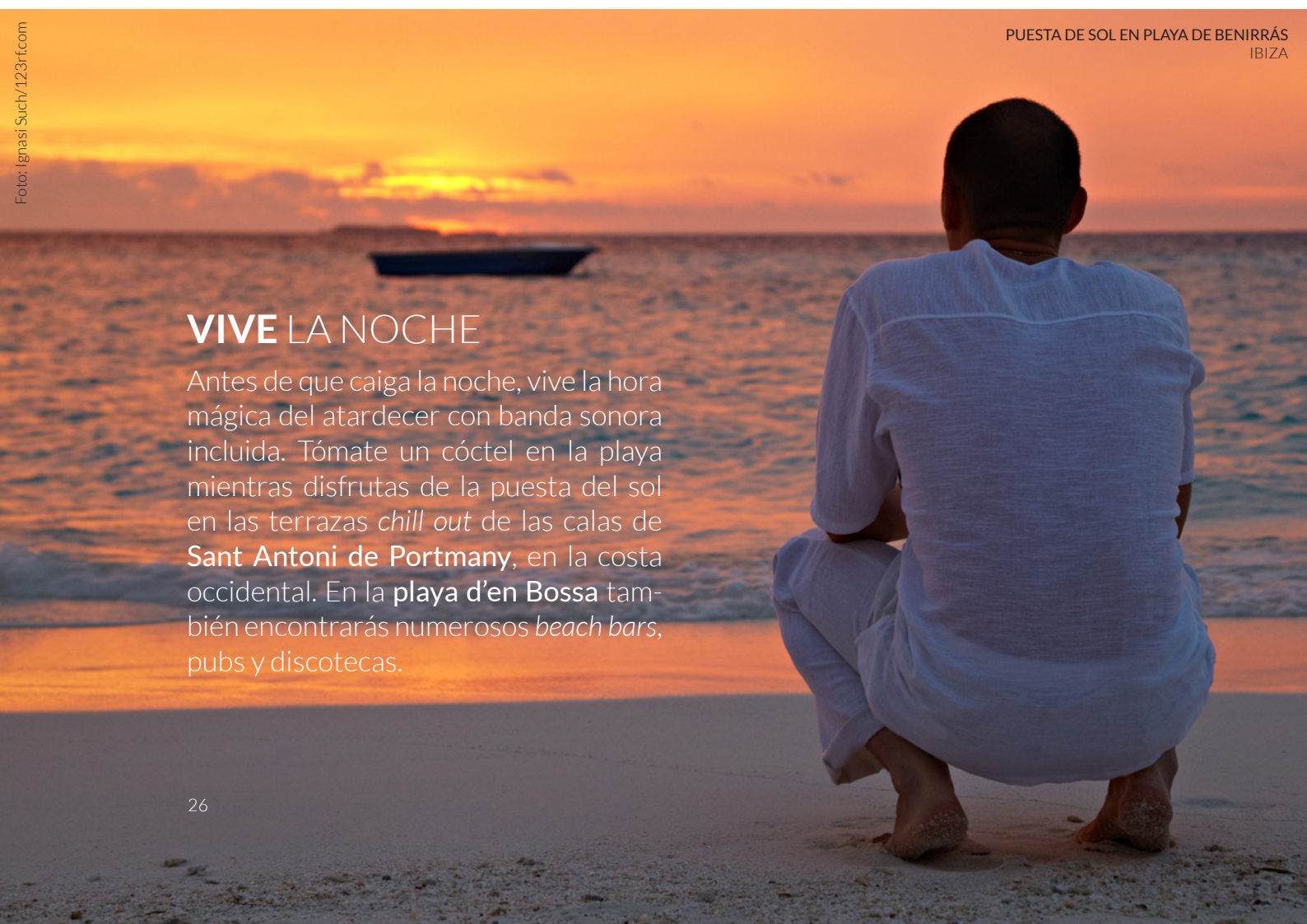
PUESTA DE SOL EN PLAYA DE BENIRRÁS IBIZA

Los paseos en bici son un plan perfecto: tienes varias rutas acondicionadas para elegir. O pedalea entre pinos, salinas y flamencos en el parque natural de Ses Salines . Otras opciones son visitar el Aquarium Cap Blanc , en Sant Antoni de Portmany, donde se pueden ver especies marinas típicas de la zona o recorrer la isla en uno de sus trenecitos turísticos (salen del puerto y diferentes playas y barrios).