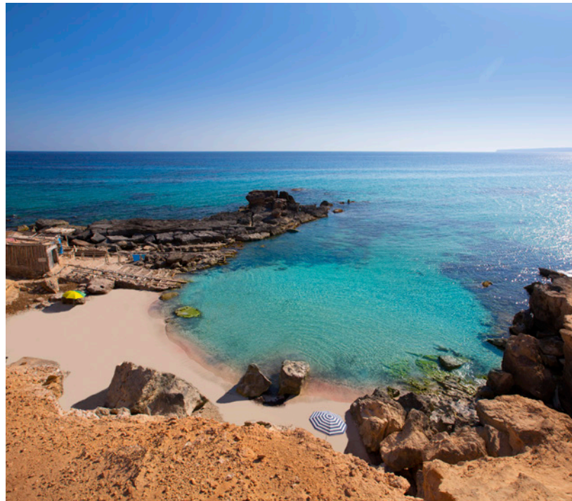
▲ CALÒ D'ES MORT FORMENTERA

La opción perfecta para quienes practican nudismo. Tiene unos 300 metros de ancho y está al pie de un acantilado. Puedes aprovechar para darte un baño de barro, como si estuvieras en un spá.