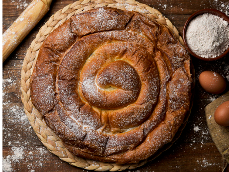
▲ ENSAIMADA MALLORCA

Merecen mención aparte los artículos de piel , como el calzado, reconocido internacionalmente por su calidad. Si quieres conocer su proceso de creación artesanal, puedes acercarte a alguno de los lugares donde lo confeccionan, como Inca, en la Comarca del Raiguer, en el centro de la isla, donde podrás visitar alguna de sus fábricas.