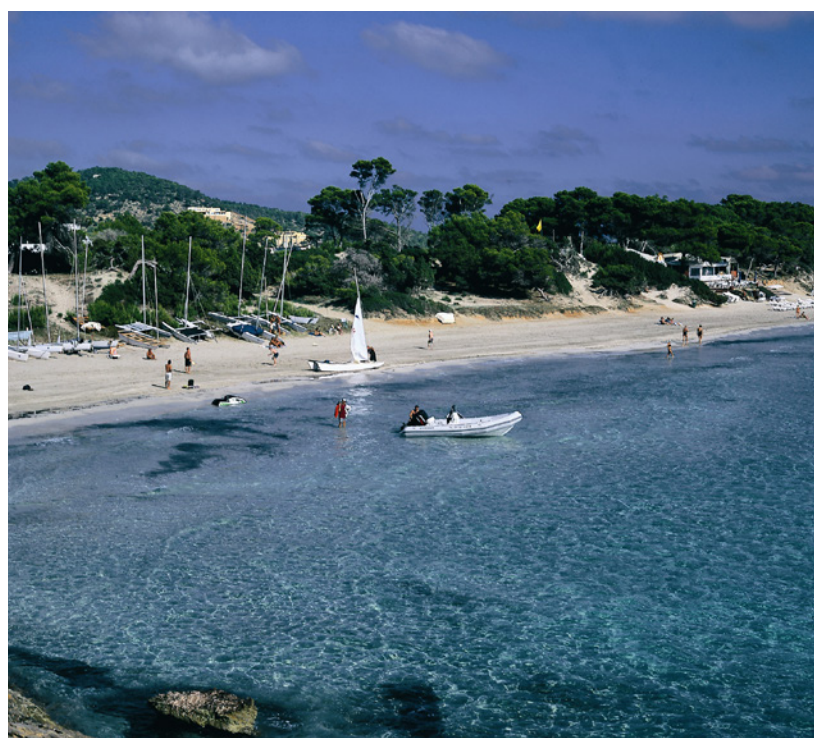
▲ PARQUE NATURAL DE SES SALINES IBIZA

Admira desde la playa la silueta de los islotes de Es Vedrà y Es Vedranell en el parque natural de Cala d'Hort, Cap Llentrisca y Sa Talaia . Es un enclave perfecto para practicar el buceo o recorrer senderos a pie o en bicicleta.