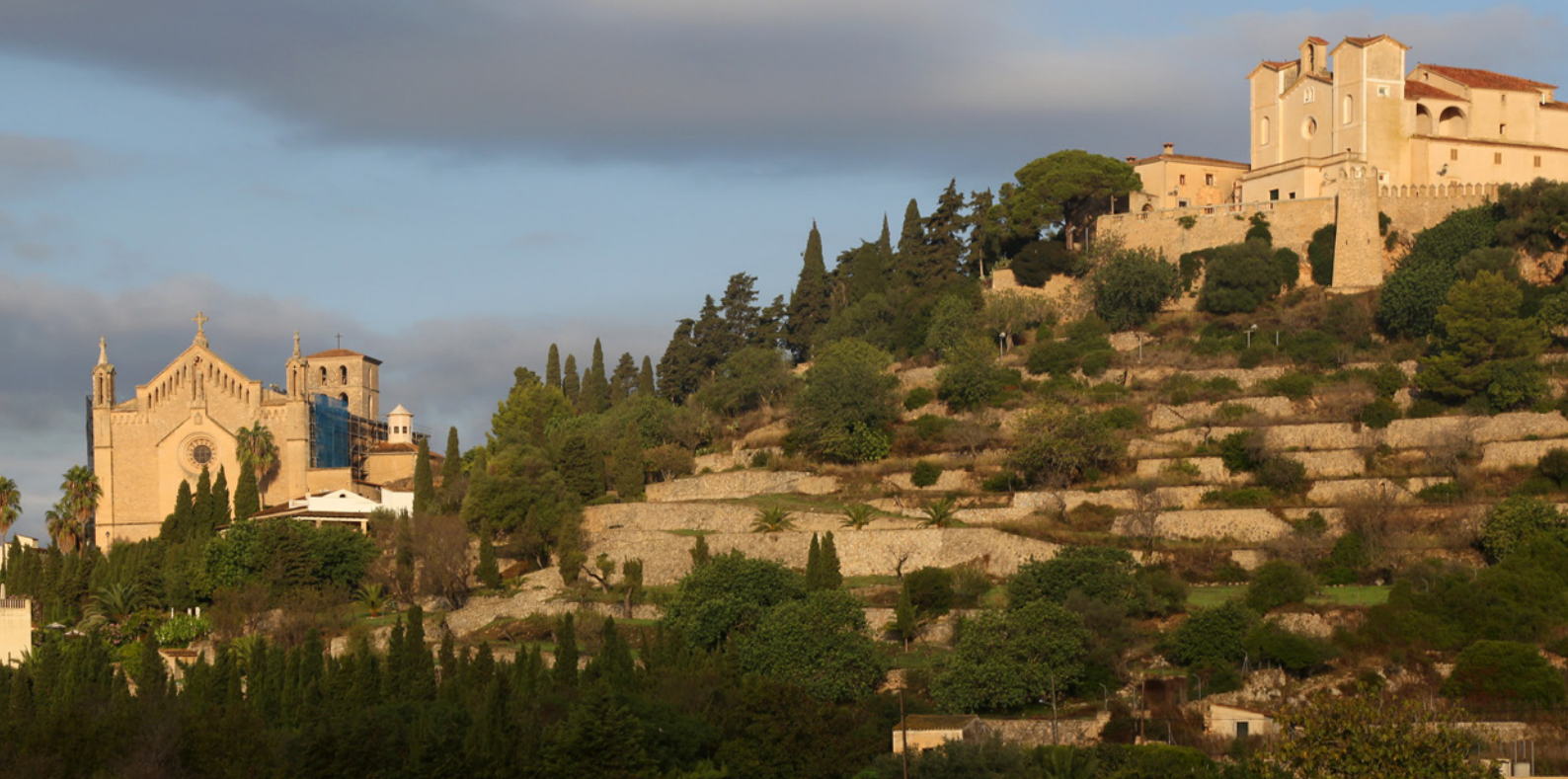
▲ ARTÁ MALLORCA

Ruta de Piedra en Seco. En el extremo más norte, embelésate con las vistas de los miradores y calas del cabo Formentor , a pocos kilómetros del puerto de Pollença. Una de las excursiones más bonitas que puedes programar durante tu estancia en Mallorca es la del monumento natural del Torrent de Pareis , un espectacular acantilado. Se trata de un impresionante cañón de 3 kilómetros que desemboca en la pintoresca playa de Sa Calobra . Descúbrelo después de una caminata o llega en barca desde el puerto de Sóller .