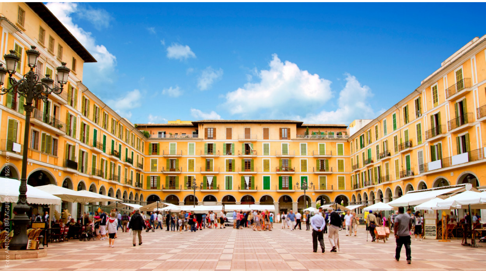
▲ PLAZA MAYOR, PALMA MALLORCA

Naturaleza, deporte, playas, pueblos con encanto, cuevas subterráneas, la oferta de ocio más divertida para familias... Mallorca tiene mucho que ofrecerte. ¿A qué esperas para conocerla?