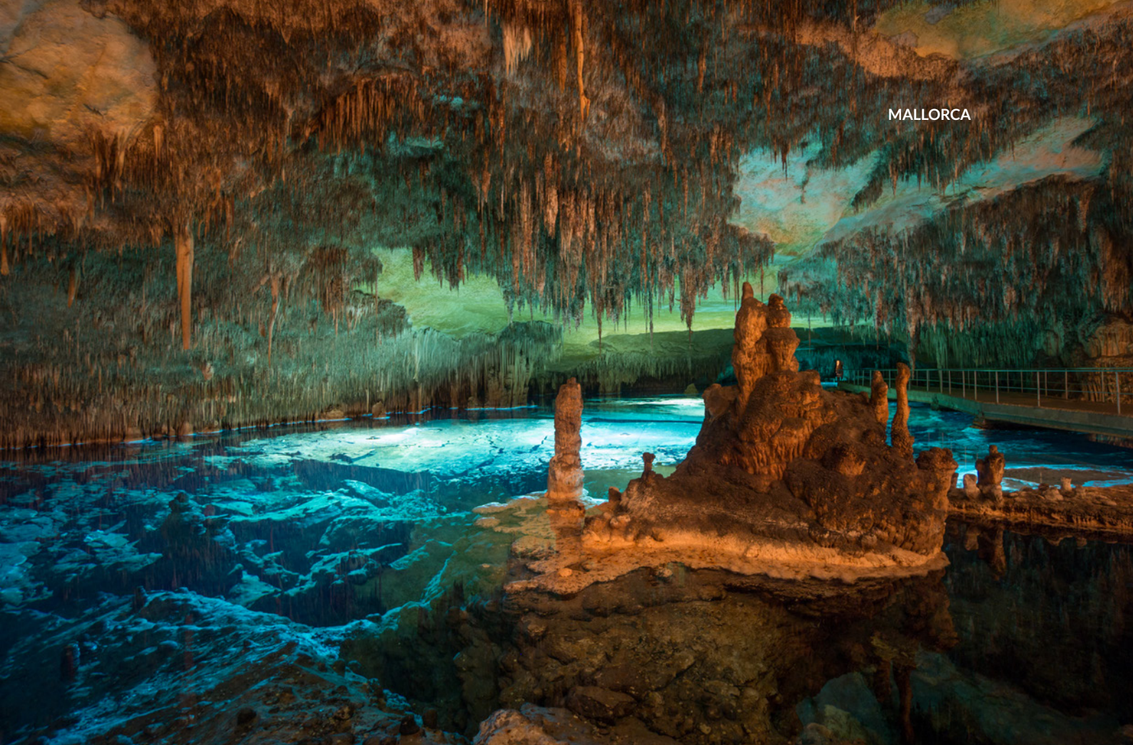
▲ CUEVAS DEL DRACH, PORTO CRISTO MALLORCA