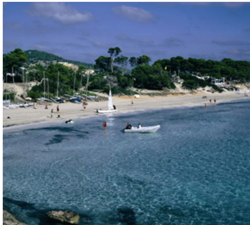
▲ NATURPARK SES SALINES IBIZA

Bewundern Sie vom Strand aus die Silhouette der Inseln Es Vedrà und Es Vedranell im Naturpark Cala d'Hort, Cap Llentrisca y Sa Talaia . Der Ort ist perfekt zum Tauchen, Wandern oder Radfahren.