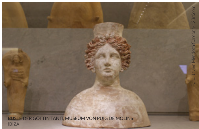
BÜSTE DER GÖTTIN TANIT, MUSEUM VON PUIG DE MOLINS IBIZA