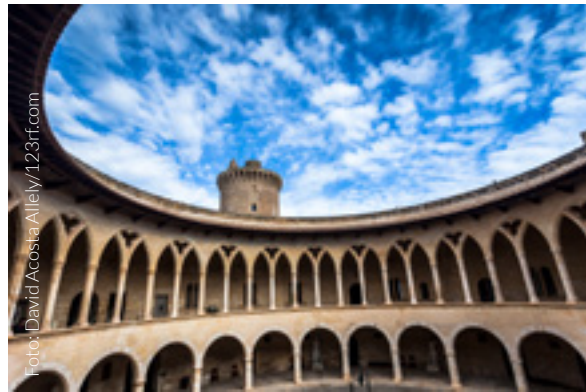
▲ BURG BELLVER, PALMA MALLORCA

Einen privilegierten Blick auf die Insel hat man von der knapp drei Kilometer von der Altstadt entfernten gotischen Burg Bellver , einer der wenigen Burgen Europas mit kreisförmigem Grundriss.