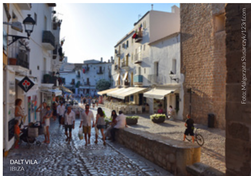
DALT VILA IBIZA