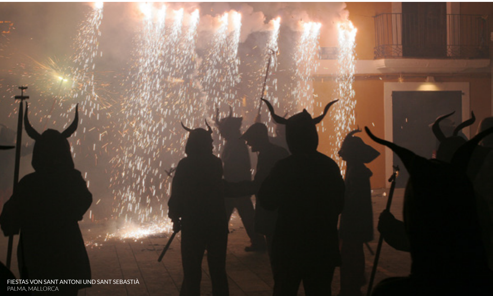
FIESTAS VON SANT ANTONI UND SANT SEBASTIÀ PALMA, MALLORCA