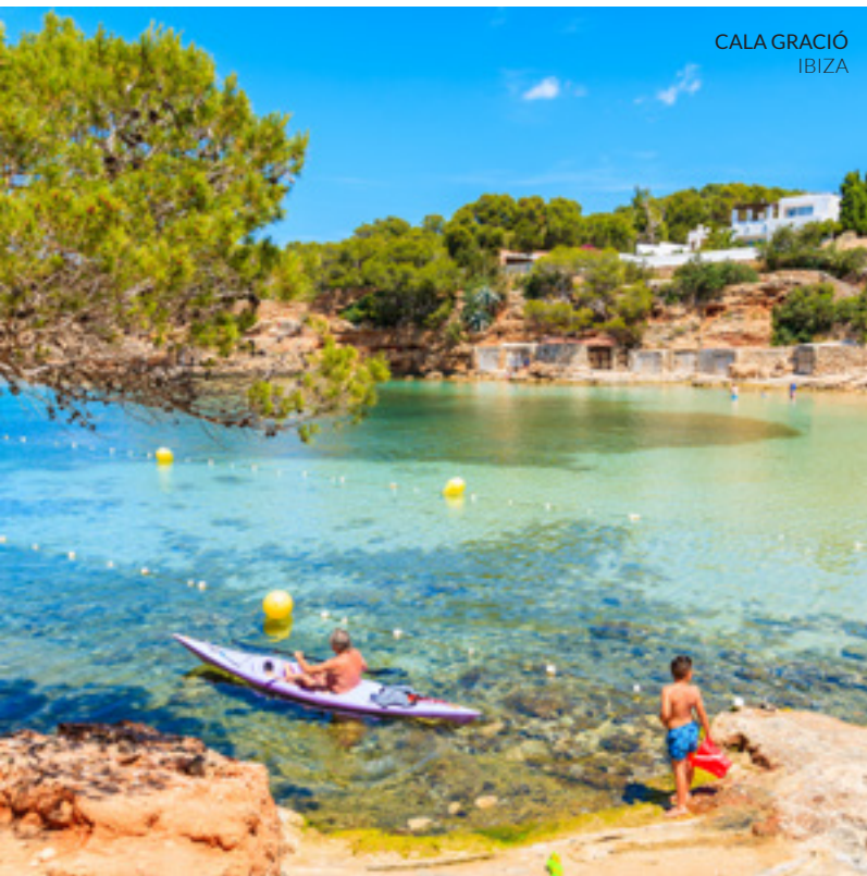
CALA GRACIÓ IBIZA