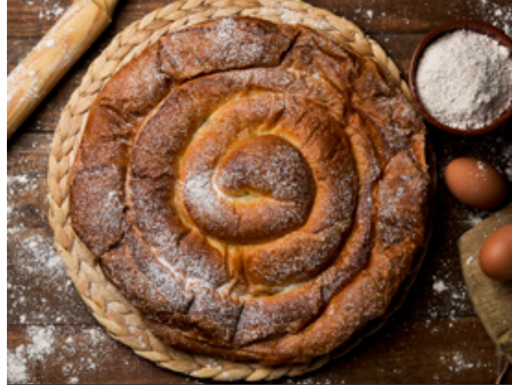
▲ ENSAIMADA-GEBÄCK MALLORCA

Besonders hervorzuheben sind Lederwaren wie Schuhe, die international für ihre Qualität bekannt sind. Wenn Sie mehr über den handwerklichen Herstellungsprozess erfahren möchten, empfiehlt sich ein Besuch in einer der Fabriken, zum Beispiel in Inca, in der Region Raiguer, im Herzen der Insel.