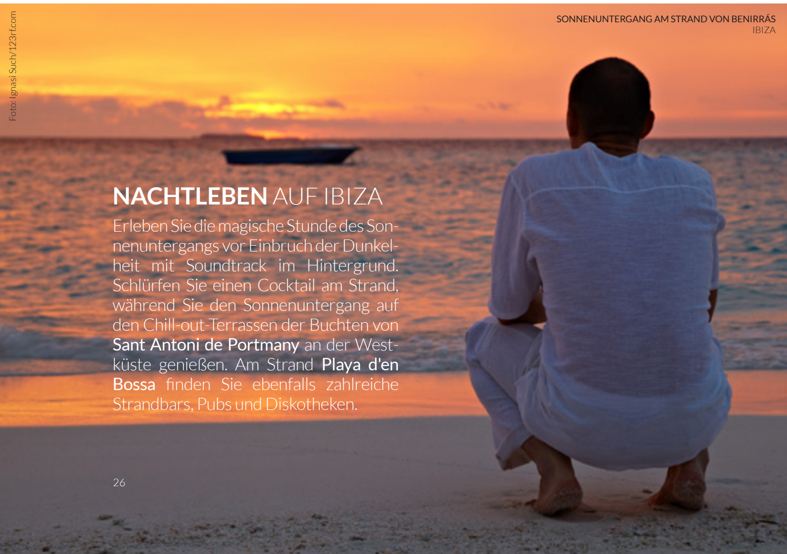
SONNENUNTERGANG AM STRAND VON BENIRRÁS IBIZA