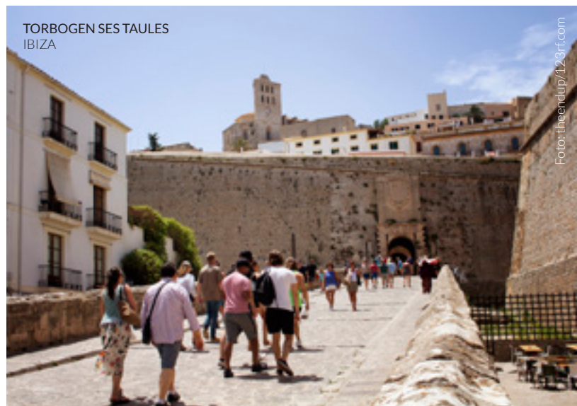
TORBOGEN SES TAULES IBIZA

Schließen Sie sich dem kreativen Tourismus an, einem neuen Trend, der von vielen Städten auf der ganzen Welt Besitz ergreift: Nehmen Sie an attraktiven Aktivitäten wie Musik-, Tanz-, Fotografie-, Sprach- oder Kochworkshops teil.