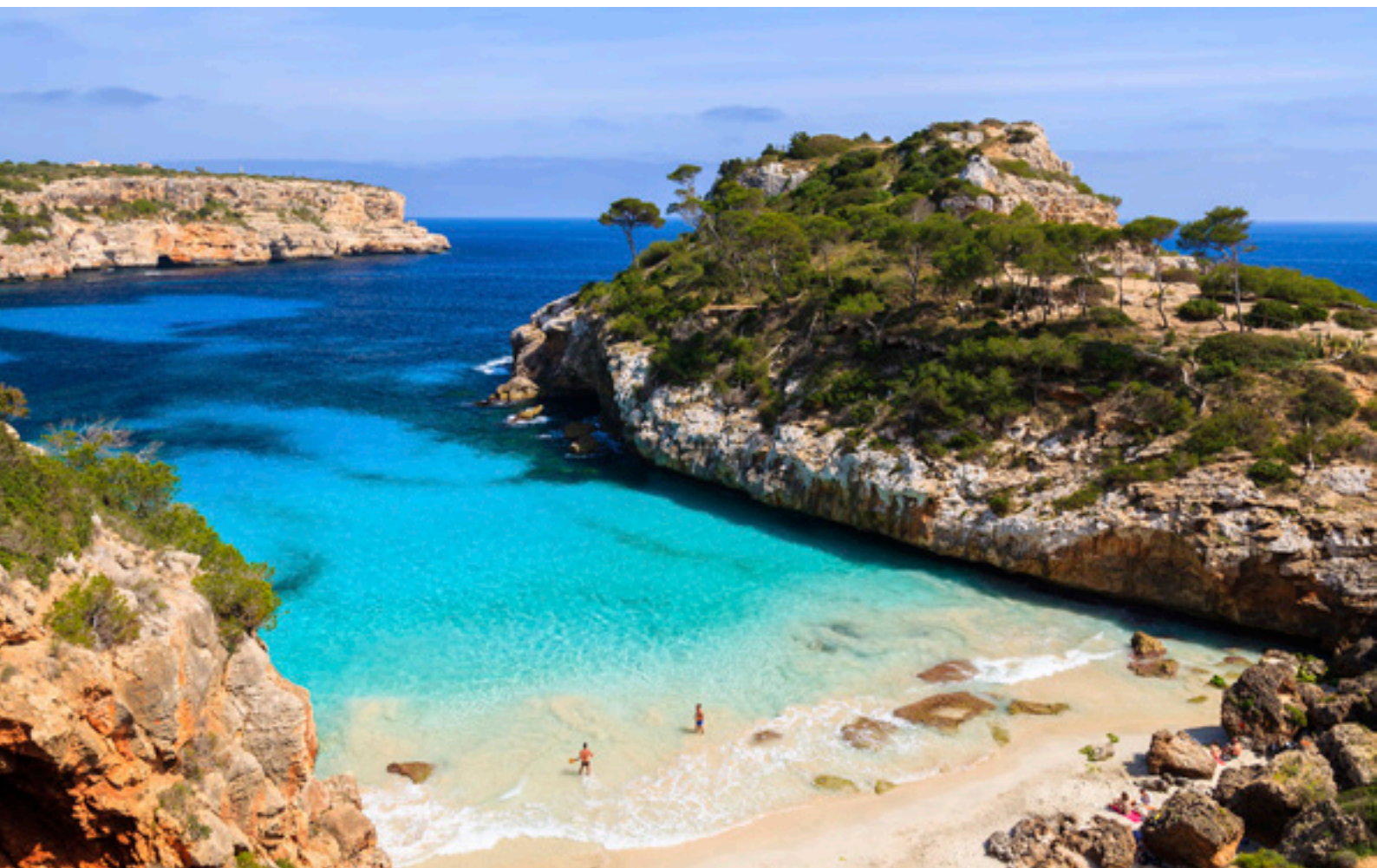
▲ CALÒ DES MORO MALLORCA

Spektakuläre Klippen, riesige unberührte Strände, bezaubernde Buchten ... Finden Sie Ihren Lieblingsstrand auf den Balearen und genießen Sie einen Traumurlaub in kristallklarem Wasser. Hier finden Sie eine kleine Auswahl von 10 idyllischen Ecken.