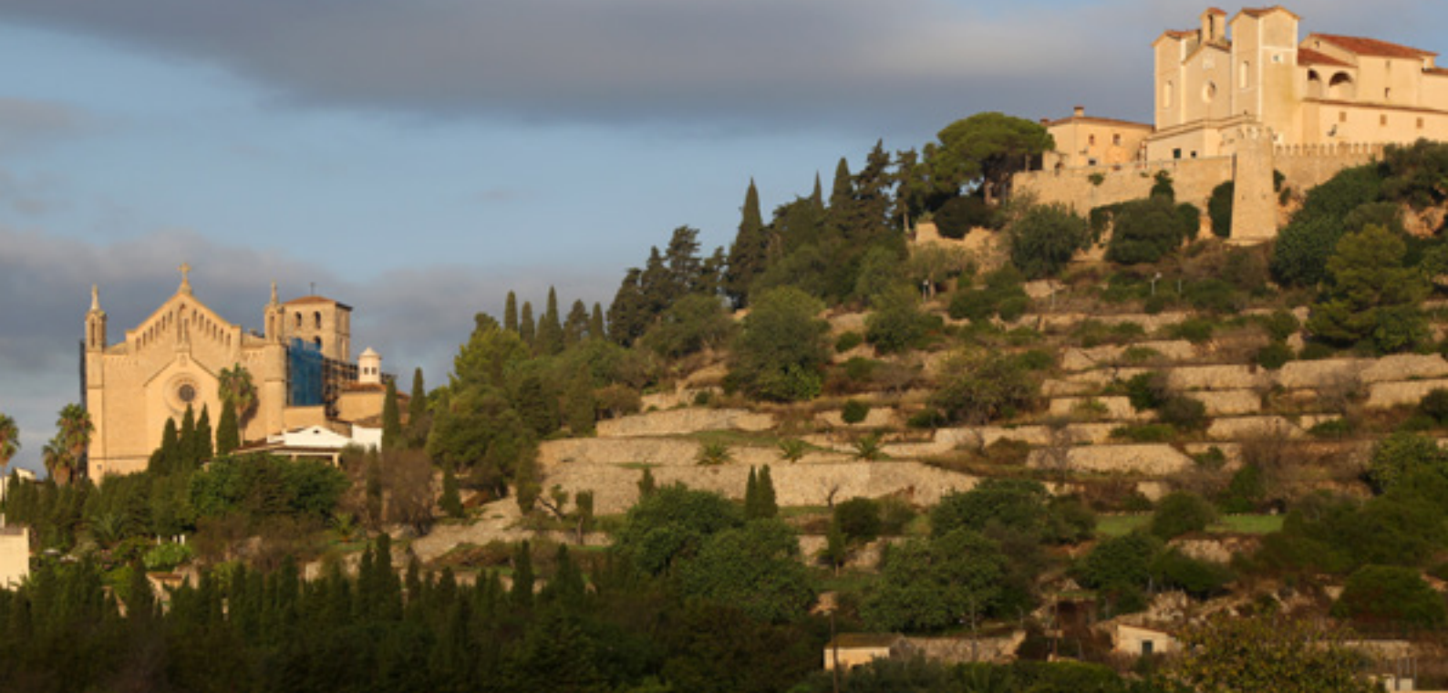
▲ ARTÁ MALLORCA

Tour von Piedra en Seco. Am nördlichen Zipfel der Insel bietet sich der Blick auf die Aussichtspunkte und Buchten des Kaps Formentor , wenige Kilometer vom Hafen von Pollença entfernt. Einer der schönsten Ausflüge während Ihres Aufenthaltes auf Mallorca führt zum Naturdenkmal Torrent de Pareis , einer spektakulären Steilküste. Der drei Kilometer lange Canyon geht in den malerischen Strand von Sa Calobra über. Entdecken Sie diesen Ort im Rahmen einer Wanderung oder einer Bootstour ab Puerto de Sóller .