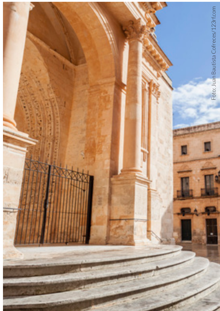
▲ KATHEDRALE SANTA MARÍA CIUTADELLA, MENORCA

In der Umgebung finden Sie megalithische Zeugnisse der prähistorischen Ursprünge. Besuchen Sie die Naveta des Tudons , ein Gemeinschaftsgrab aus der Bronzezeit, eines der ältesten Bauwerke Europas.