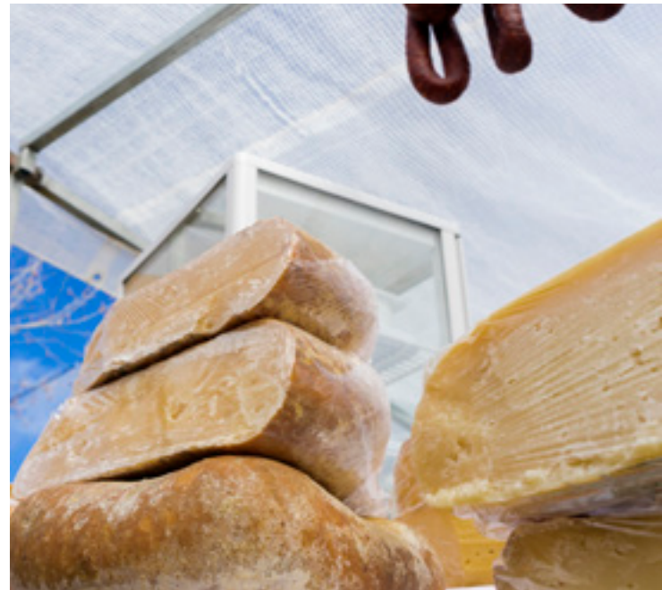
▲ KÄSE AUS MAHÓN MENORCA

Auf dem Kunsthandwerkmarkt von Ciutadella , der auch im Sommer geöffnet ist und zu den belebtesten gehört, finden Sie einfach alles, von Schmuck und Schuhen bis hin zu Keramik und Illustrationen.